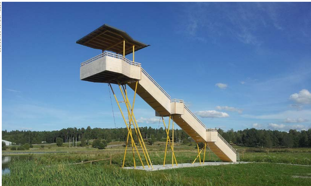
Fågeltornet i Steningedalen är lika mycket ett konstverk som ett fågeltorn.