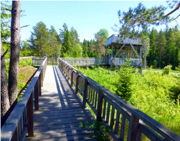
Nära Skutans gård ligger ett av de minst kända fågeltornen.