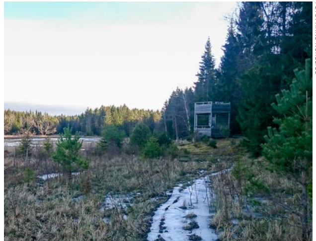
Fågeltornet i Tyresta nationalpark ligger i en skogskant.

Övrigt: Med utgångspunkt från fågeltornet finns en natur-slinga med 14 infotavlor om området natur. Skutans gård är en ideellt driven hästgård för barn och unga. Ibland anordnas ponnyridning, så exkursionsmålet passar den skådande barnfamiljen. Sörmlandsleden passerar förbi gården.