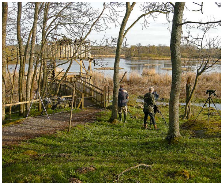
Från fågeltornet har man en utmärkt utsikt över Ågestasjön.