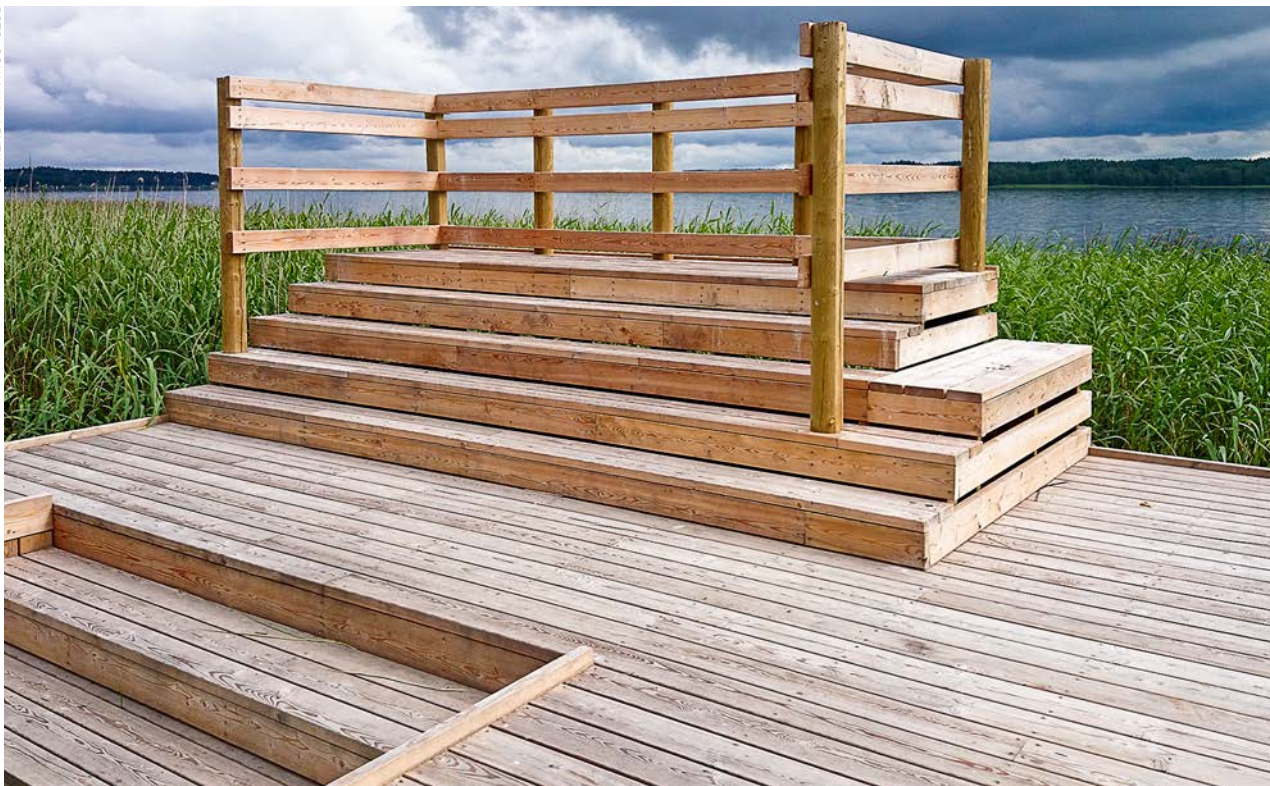
Observationsplatsen vid Ullnasjön ger en mycket bra utsikt över sjön i princip hela den ljusa delen av dygnet.