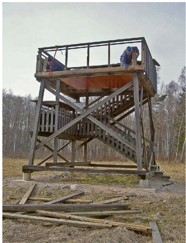
Fågeltornet vid Sandemar är stort och stabilt, men även stabila fågeltorn behöver repareras.