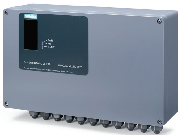
SIMATIC CFU PA im Aluminiumgehäuse