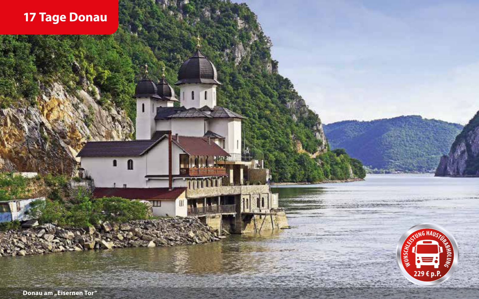
Donau am „Eisernen Tor“