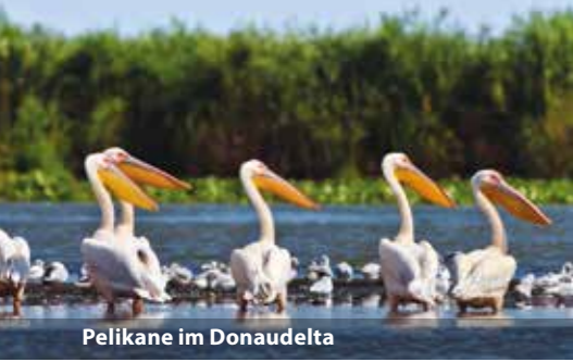
Pelikane im Donaudelta

Unser Schiff erreicht flussaufwärts die malerisch gelegenen Orte Weißenkirchen oder Spitz. Anschließend gelangen wir zurück nach Passau und nehmen Abschied von unserem „schwimmenden Hotel“.