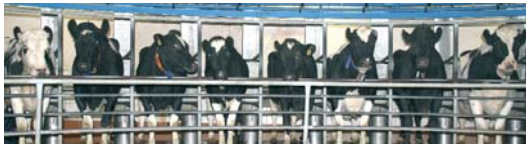
Milchkühe im Melkkarussell

Eine Körper-Temperaturerhöhung ist oft ein wichtiger Indikator für die Diagnose von Erkrankungen. Am Beispiel einer Milchkuhherde mit 500 Tieren wird sehr schnell deutlich, dass man mit einer herkömmlichen manuellen Fiebermessung – selbst wenn sie pro Tier nur Sekunden dauert – keine Chance hat, um die Tiergesundheit flächendeckend zu überwachen.