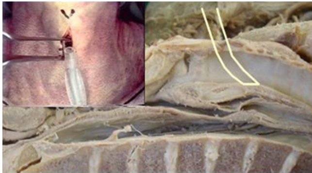
Abb. 1 Koniotomie mittels chirurgischer Präpariertechnik (Inlet nach [16])

Zur Durchführung der Koniotomie wurden mehrere Techniken beschrieben. Die Verfahren können grob in das chirurgische Vorgehen mit anatomischer Präpariertechnik ( Abb. 1 ) und in Punktionsverfahren ( Abb. 2 , Abb. 3 ) eingeteilt werden. Hierzu wurden verschiedene industriell vorgefertigte Instrumentarien entwickelt. Einen Sonderfall stellt hierbei die sog. Ravussin-Kanüle dar, die im Wesentlichen aus einem Teflon-Katheter besteht und die im Gegensatz zu den anderen Verfahren mittels eines Jet-Systems allenfalls eine Oxygenierung, nicht jedoch eine Ventilation ermöglichen dürfte [20]. Der Zwischenschritt, der vereinzelt propagiert wurde, liegt zwischen Intubation und Koniotomie und besteht also in der transtrachealen Jet-Oxygenierung, wobei diese Maßnahme im Rettungsdienst selten zur Verfügung stehen dürfte. Als Option würde man diese Maßnahme allerdings nicht grundsätzlich ausschließen.