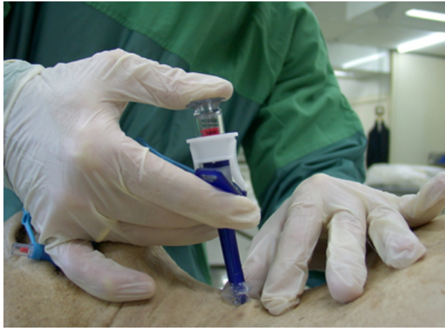
Abb. 3 Position bei der Punktion mit dem Portex Crico Kit

Bei der Koniotomie mittels chirurgischer Präpariertechnik ( Abb. 1 ) zeigt bei der Tubusinsertion mit Hilfe des langen Killian-Spekulums der Schliff nach oben. Nach der Insertion wird der Tubus 180° nach kranial gewendet, sodass der Schliff wie in der Skizze an der Tracheahinterwand anliegt. So wird das Verletzungsrisiko der Schleimhaut minimiert und der Tubus schlägt nicht nach kranial um.