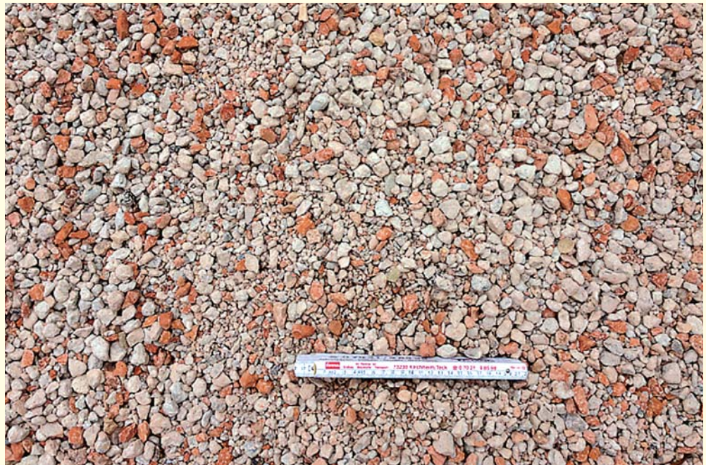
RC-Gesteinskörnung für Transportbetonwerke nach Liefertyp 2

Sowohl die Entwicklung der Aufbereitungsstrategie für diese Gesteinskörnung als auch die Entwicklung der Betonrezepturen waren erfolgreich.