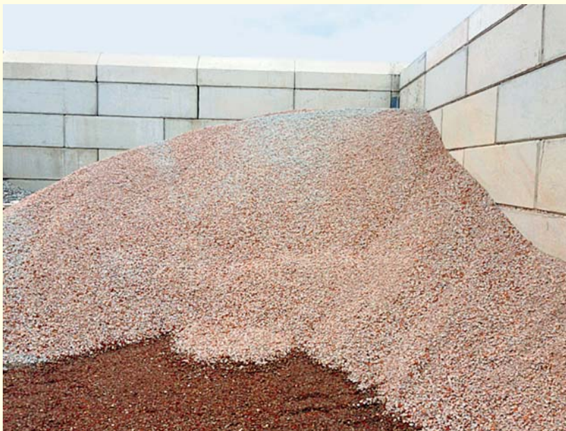
Produktthalde RC-Gesteinskörnung für Transportbetonwerke nach Liefertyp 2

Dies bedeutet, dass ein Verfahren für eine dokumentierte Eingangskontrolle festgelegt sein muss. Aufgrund der Angaben im Anlieferungsschein, durch organoleptische Prüfung vor und nach dem Abkippen der angelieferten Materialien, ist festzustellen, ob die Zusammensetzung der angelieferten Materialien der Angaben des Anlieferers entspricht. Die zu dokumentierenden Angaben sind in dem Regelwerk festgelegt.