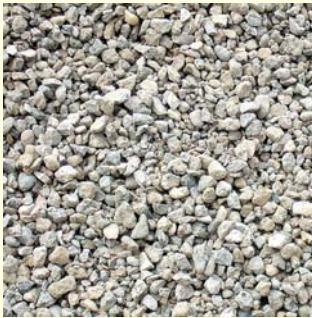
Produktthale aus gebrochenem Altbeton

schaften. Hier lagen die nach 28 Tagen erreichten Druckfestigkeiten im Mittel bei 46,4 \text{ N/mm}^2 (Beton 2; Zielwert 47 \text{ N/mm}^2 ) bzw. bei 66,5 \text{ N/mm}^2 (Beton 3; Zielwert 55 \text{ N/mm}^2 ). Ein weiteres wichtiges Kriterium ist der Frost-Tausalz-Widerstand des Betons. Die Betone 2 und 3 mussten für den Einsatz in der Stützmauer die Expositionsklasse XF 4 und XF 2 erfüllen, was sich nur direkt am Beton durch einen CDF-Test (Kapillares Saugen von Taumittellösungen und Frost-Tau-Wechsel-Versuch) prüfen ließ. Die Ergebnisse dieser Prüfung waren sehr erfreulich, die ermittelten Abwitterungswerte lagen sehr deutlich unter den Grenzwerten.