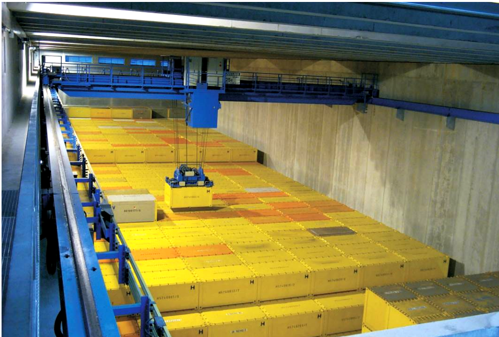
Abbildung 9: Zwischenlager bei den Entsorgungsbetrieben der KTE

Für die Entsorgungsbetriebe besitzt die KTE eine Umgangsgenehmigung nach § 9 AtG. Dementsprechend sind bei den Teilbetriebstätten der Zwischenlager (LAW und MAW) die maximalen Aktivitäten (Umgangsmenge) genehmigt und nicht die Kapazität. Auf Grundlage einer möglichen Belegung der Zwischenlager mit Zwischenlagerbehältern können Lagerkapazitäten berechnet werden.