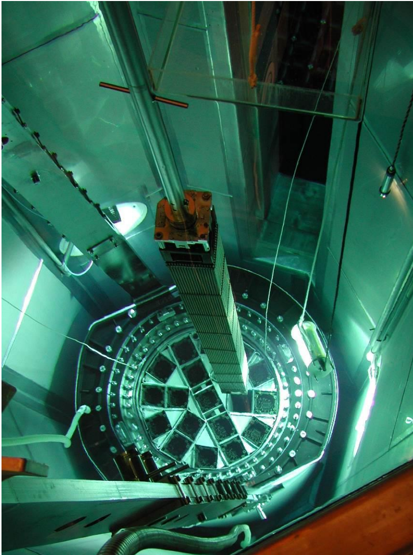
Abbildung 10: Beladung eines Castor-Behälters mit einem Brennelement (Beladung unter Wasser im Lagerbecken)

Für eine direkte untertägige Endlagerung ist die verbleibende Wärmeentwicklung dann allerdings immer noch zu hoch. Daher müssen vor einer Endlagerung die Brennelemente ebenso wie die hochradioaktiven verglasten Abfälle (Glaskokillen) aus der Wiederaufarbeitung noch einmal 30 bis 40 Jahre zwischengelagert werden, sodass ihre Nachzerfallswärme weiter abklingt. Dabei hat das für die Endlagerung vorgesehene Wirtsgestein einen bedeutenden Einfluss auf die erforderliche Abklingzeit.