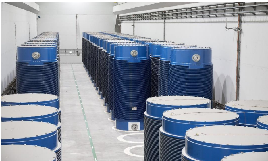
Abbildung 11: Standortzwischenlager Neckarwestheim

Bei den in Deutschland genehmigten Zwischenlagern handelt es sich überwiegend um bauliche Anlagen gemäß STEAG-Konzept (STEAG Energy Services GmbH mit Sitz in Essen) oder WTI-Konzept (Wissenschaftlich-technische Ingenieurberatung GmbH mit Sitz in Jülich). Die baulichen Anlagen gemäß STEAG-Konzept besitzen eine Wandstärke von circa 1,2 Metern und sind einschiffig aufgebaut. Die baulichen Anlagen gemäß WTI-Konzept besitzen eine Wandstärke von circa 0,85 Metern und sind zweischiffig aufgebaut. Bei den Zwischenlagern an den süddeutschen Standorten, so auch in Philippsburg, wurde das WTI-Konzept verwirklicht.