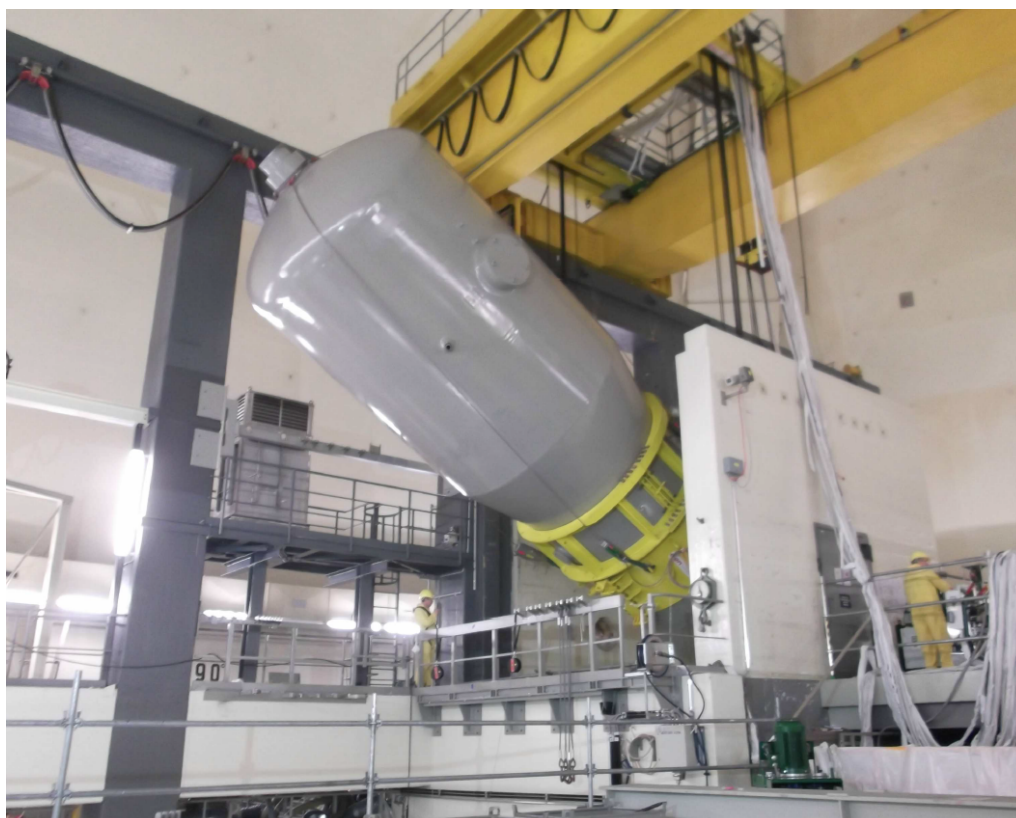
Abbildung 5: Abbau eines Dampferzeugers im Kernkraftwerk Obrigheim im Rahmen der 2. SAG

Bundes für schwach- und mittelradioaktive Abfälle zugeführt werden müssen. 1 Das tatsächliche Volumen der Stilllegungs- und Rückbauabfälle ist jedoch erheblich von der Größe beziehungsweise Leistung und dem Typ eines Kernkraftwerks (Siedewasserreaktor oder Druckwasserreaktor) abhängig.