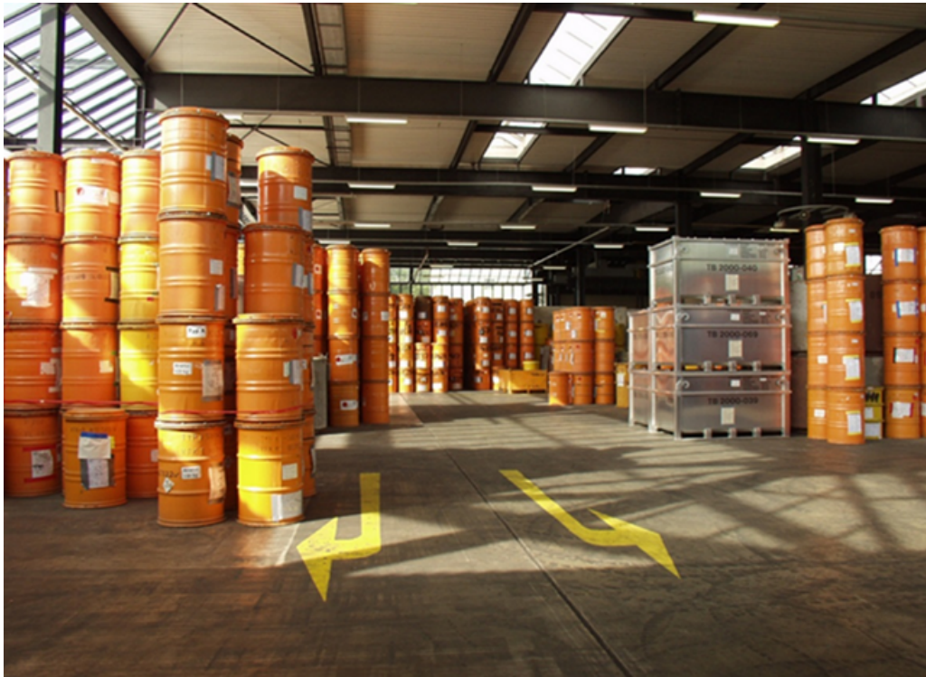
Abbildung 6: Reststoffeingangslager der Entsorgungsbetriebe

Zur Erledigung dieser Aufgabe hat das Land Baden-Württemberg mit dem damaligen Forschungszentrum Karlsruhe einen Vertrag geschlossen, aufgrund dessen nun die KTE als diesbezügliche Rechtsnachfolgerin des Forschungszentrums Karlsruhe mit ihren Entsorgungsbetrieben nahezu alle Aufgaben und Pflichten für das Land erfüllt. Dementsprechend nehmen die Entsorgungsbetriebe der KTE Aufgaben wie die Annahme und die Konditionierung der radioaktiven Abfälle sowie die Zwischenlagerung und den späteren Abtransport zum Endlager wahr.