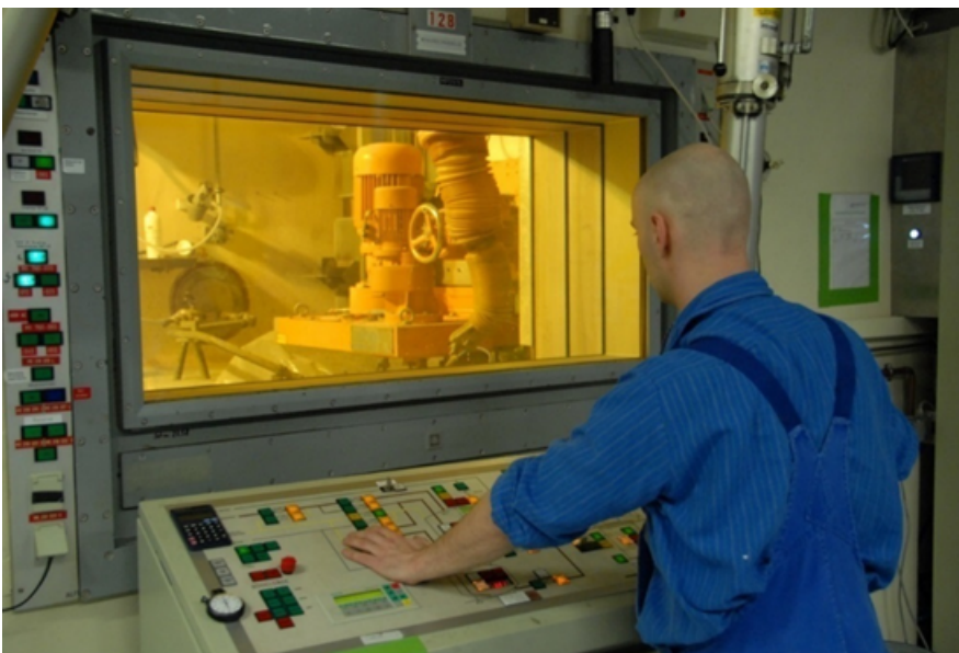
Abbildung 8: Zementierung von Verdampferkonzentraten bei den Entsorgungsbetrieben

Über Baden-Württemberg hinaus sind als Beispiele für bedeutende zentrale Abfallbehandlungsanlagen, in denen auch Abfälle aus Baden-Württemberg konditioniert werden, die GNS-Anlagen in Jülich, die Einschmelzanlage von Siempelkamp in Krefeld oder die Verbrennungsanlage von Cyclife in Nyköping (Schweden) zu nennen.