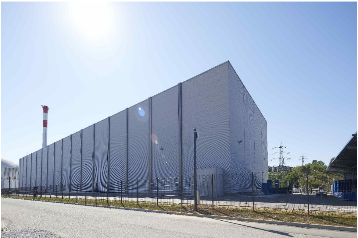
Abfall-Zwischenlager Neckarwestheim (AZN)