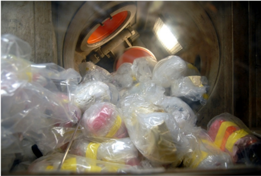
Abbildung 7: Beschickungsbox der Verbrennungsanlage bei den Entsorgungsbetrieben

Die umfangreichsten Konditionierungsanlagen Deutschlands betreiben die Entsorgungsbetriebe der KTE auf dem Gelände des KIT Campus Nord. Dort können schwach- und mittelradioaktive Abfälle beziehungsweise Reststoffe zerlegt, sortiert, dekontaminiert, falls möglich freigegeben oder durch fachgerechtes Konditionieren für die Endlagerung vorbereitet werden.