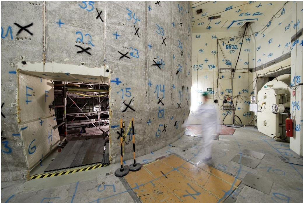
Abbildung 4: Reaktorgebäude des sich im fortgeschrittenen Rückbau befindlichen MZFR (Markierungen an den Gebäudestrukturen rühren aus Messungen zum Zweck der Freigabe her)

Der Betrieb der Kernkraftwerksblöcke GKN I und KKP 1 wurde wenige Tage nach dem Beginn der Nuklearkatastrophe in Japan aufgrund einer aufsichtlichen Anordnung im März 2011 vorläufig eingestellt. Wenige Monate später war es diesen Anlagen mit dem Inkrafttreten der 13. Atomgesetznovelle (vom Juli 2011) nicht mehr erlaubt, den Leistungsbetrieb aufzunehmen.