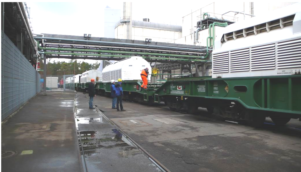
Abbildung 3: Im Februar 2011 auf dem Gelände der WAK zum Abtransport bereitstehende, mit Glaskokillen beladene Castor-Behälter

Der Rückbau des Prozessgebäudes, in dem die eigentliche Wiederaufarbeitung stattfand, hatte schon Mitte der 1990er Jahre mit der Demontage einzelner Komponenten begonnen. Nach der Verglasung der Spaltproduktlösung können die ehemaligen HAWC-Lagerbehälter und die Verglasungsanlage selbst abgebaut werden. Außer Betrieb genommene Komponenten wurden bereits teilweise abgebaut. Mit den Arbeiten zur Demontage von HAWC-Lagertanks und -Prozesskomponenten wurde begonnen. Die WAK und die VEK sollen nach Auskunft des Betreibers bis Anfang 2047 vollständig abgebaut werden.