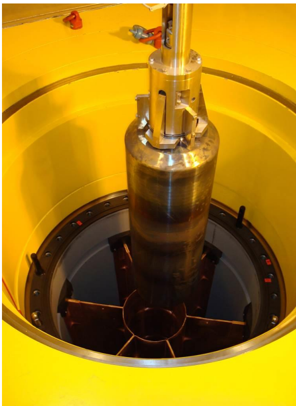
Abbildung 2: Castor-Beladung mit einer Glaskokille („kalte“ Handhabung)

Fünf mit jeweils 28 hochradioaktiven Glaskokillen beladenen Castor-Behälter wurden im Jahr 2011 vom Gelände der Wiederaufbereitungsanlage Karlsruhe in das Zwischenlager Nord (ZLN) bei Greifswald transportiert.