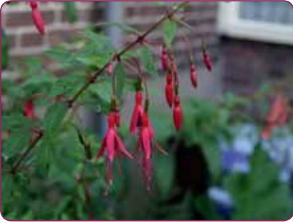
F. magellanica gracilis

maar de kleur van het blad vergoedt dat helemaal. Dan is er nog een grote variatie in blad- en bloemvorm.