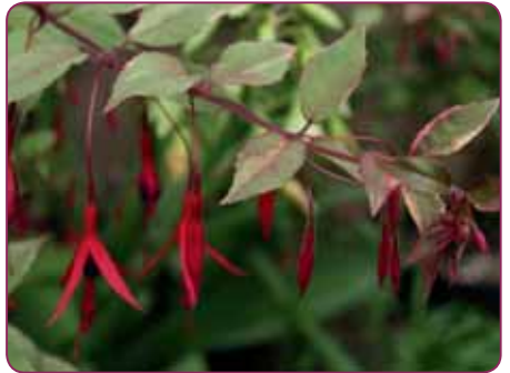
F. magellanica tricolori