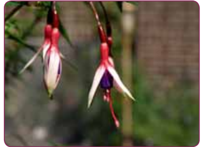
F. magellanica arauca

zijn prachtig paarsrood) en F. magellanica var. aurea (=geel, dus met geelgroen tot goudgeel blad, afhankelijk van de hoeveelheid zon). De bloei van deze bladvariëteiten is wel minder,