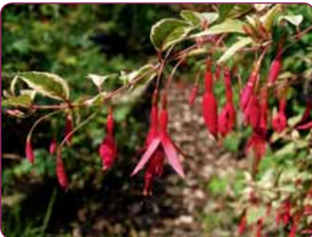
F. magellanica versicolor