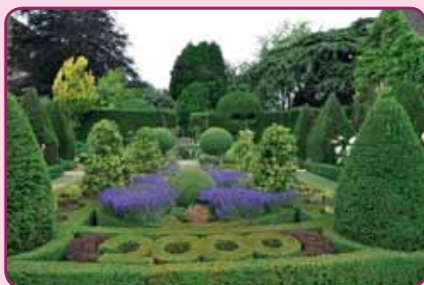
The Abbey House Gardens