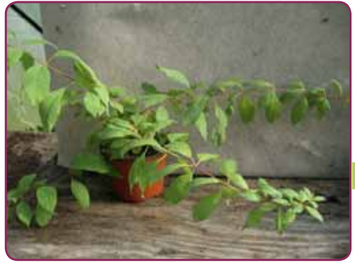
Foto 2 F. cestroides in het najaar