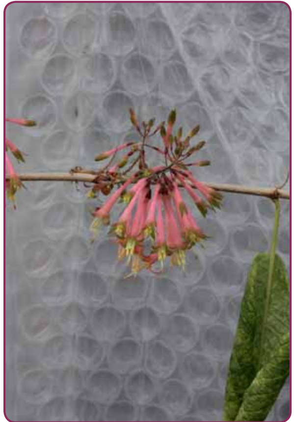
Foto 3 F. cestroides in bloei