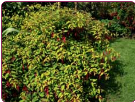
F. magellanica aurea

Er zijn nu nog 6 varianten met een zaainummer aanwezig, die onderling grote verschillen tonen. Er zijn er 2 met witte bloemen, de F. magellanica var. alba ( alba staat voor wit) en de