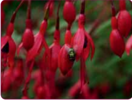
F. magellanica 80-540

delli, een Italiaans-Portugees botanicus, maar later als sectie ingelijfd bij het geslacht Fuchsia . Deze sectie omvat in totaal 9 soorten, dus niet eens zo'n grote sectie, maar er zijn tientallen variaties binnen die soorten waardoor er bijna 100 namen of nummers op de lijst staan. We beginnen met Fuchsia magellanica , vroeger dus Quelusia magellanica , de meest bekende winterharde fuchsia.