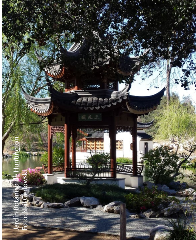
Jardín Botánico de Huntington

Agradezco a la Asociación Internacional de Jardines Botánicos para la Conservación (BGCI por sus siglas en inglés) por solventar la mayoría de mis viajes, en este caso para mi y para nuestro coordinador de investigaciones del jardín, Alan Heinze, para participar en el taller de International Plant Sentinel Network enfocado a las plagas y otros patógenos que representan una amenaza para EE.UU. y México. Los jardines botánicos coordinan esfuerzos a través de organizaciones como BGCI para multiplicar su alcance y lograr un impacto significativo en la conservación de las plantas.