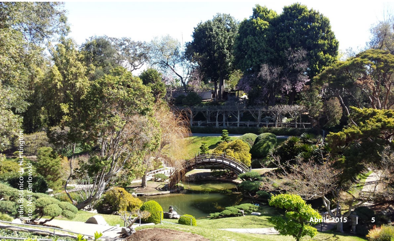
Jardín Botánico de Huntington