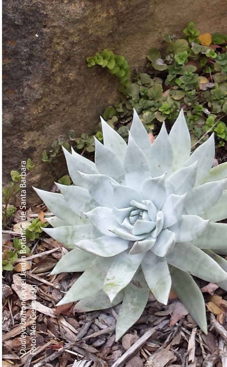
Dudleya brittonii en el Jardín Botánico de Santa Bárbara

El mes pasado, el director ejecutivo del JBSB, el Dr. Steve Windhager, me hospedó por varios días en su casa cuando visité su jardín, Lotusland, Casa del Herrero y el museo de historia natural de Santa Bárbara. EL JBSB celebrará su 90 aniversario en este venidero 2016 acompañado de la gran inauguración de su nuevo centro de visitantes, el cual ahora se encuentra en construcción. El JBSB fue el primer jardín botánico de los Estados Unidos establecido con la estricta misión enfocada en las plantas nativas y ofrece un recurso increíble para quienes buscan explorar la rica y diversa flora de California. Cualquier visita a Santa Bárbara debe incluir tiempo especialmente reservado para experimentar las maravillas naturales en el Jardín Botánico de Santa Bárbara.