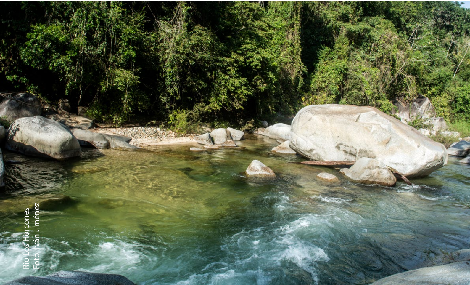
Río Los Horcones

Como parte de su compromiso con la comunidad de Puerto Vallarta, el Jardín Botánico permanece abierto todo el año, cerrando solamente los lunes desde abril hasta finales de noviembre, al igual que en Navidad y en Año Nuevo. Por favor planea tu visita adecuadamente. El siguiente lunes que abriremos será el 7 de diciembre. Ven a visitarnos cualquier otro día de la semana.