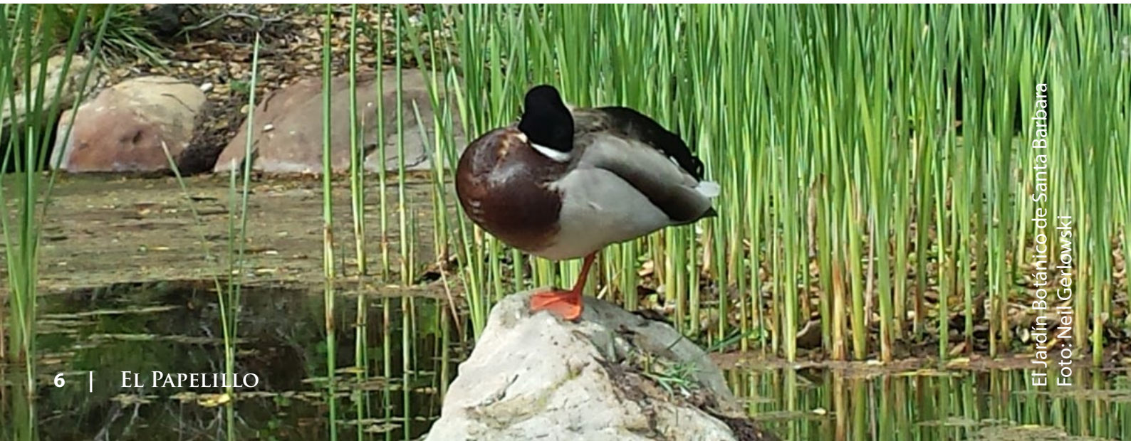
El Jardín Botánico de Santa Bárbara