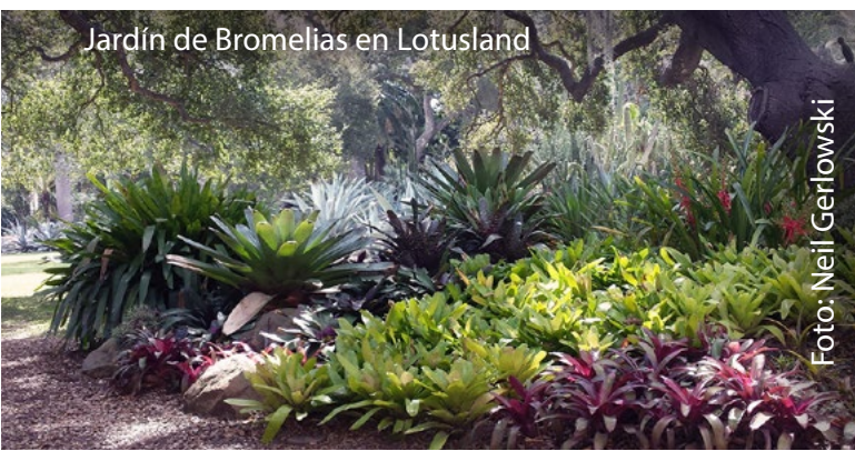
Jardín de Bromelias en Lotusland

Quienes vivimos en México, no importa desde cuándo, continuamente encontraremos camaradas en diversos lugares, hasta en el más lejano rincón de la tierra. Sin embargo, el mes pasado me sorprendí de ver a un grupo de jaliscienses en el paisaje surrealista del Lotusland Ganna Walska en Montecito, California. En este caso no era un grupo de personas, sino un grupo de plantas en el Jardín de las Bromelias en Lotusland. Estas plantas, conocidas con el nombre científico Ursulea tuitensis , son endémicas de una pequeña área de las montañas que circundan el Jardín Botánico de Vallarta y del poblado vecino El Tuito. Ursuleas son plantas increíblemente raras con solamente una especie en su género — Ursulea macvaughii — nativa del sur de Jalisco hasta Michoacán. Considerando que Montecito es el vecino de la Ciudad Hermana de Puerto Vallarta, es incluso más apropiado que tengamos como una excelente representación a esta embajadora botánica única.