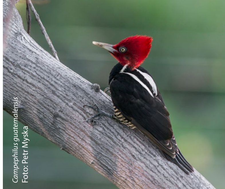
Campephilus guatemalensis

Está considerada dentro de la lista de especies amenazadas, declarada por la Unión Internacional para la Conservación de la Naturaleza (UICN).