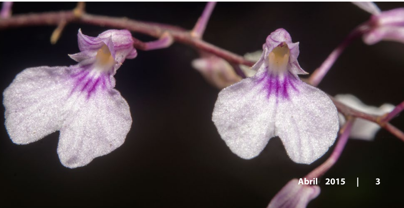
Ionopsis utricularioides

Cabe señalar que, actualmente, esta especie enfrenta serios problemas de conservación, debido principalmente a la pérdida de su hábitat por la deforestación, la ganadería extensiva y la creciente urbanización.