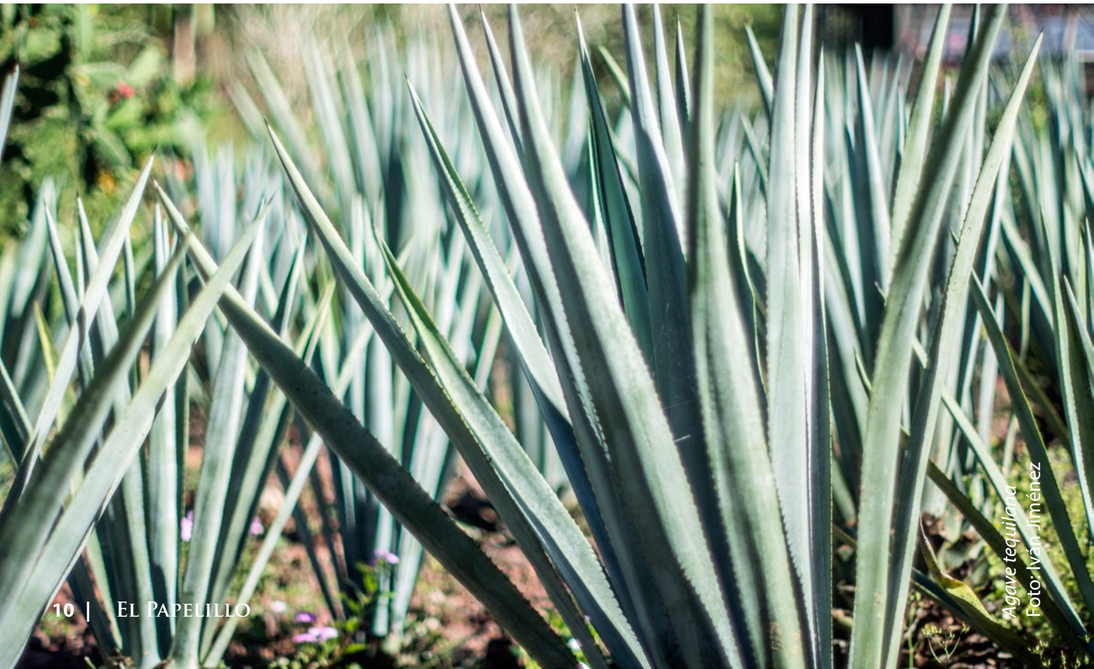
Agave tequilana

Toma nota: el Jardín cerrará sus puertas al público a las 12:00 pm el día del evento.