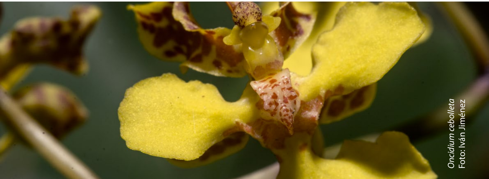
Oncidium cebolleta

* Algunas actividades pueden cambiar. Revisa el calendario con ligas que contienen mayor información en www.vbgardens.org/calendar