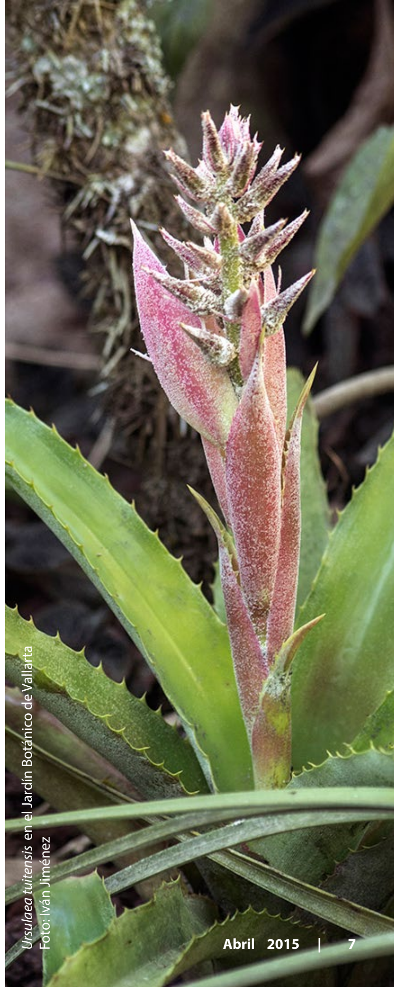
Ursulea tuitensis en el Jardín Botánico de Vallarta