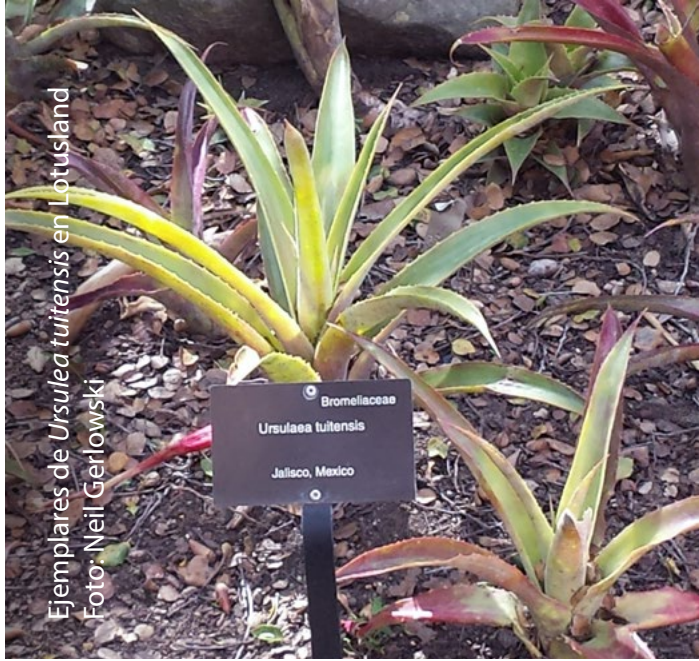
Ejemplares de Ursulea tuitensis en Lotusland