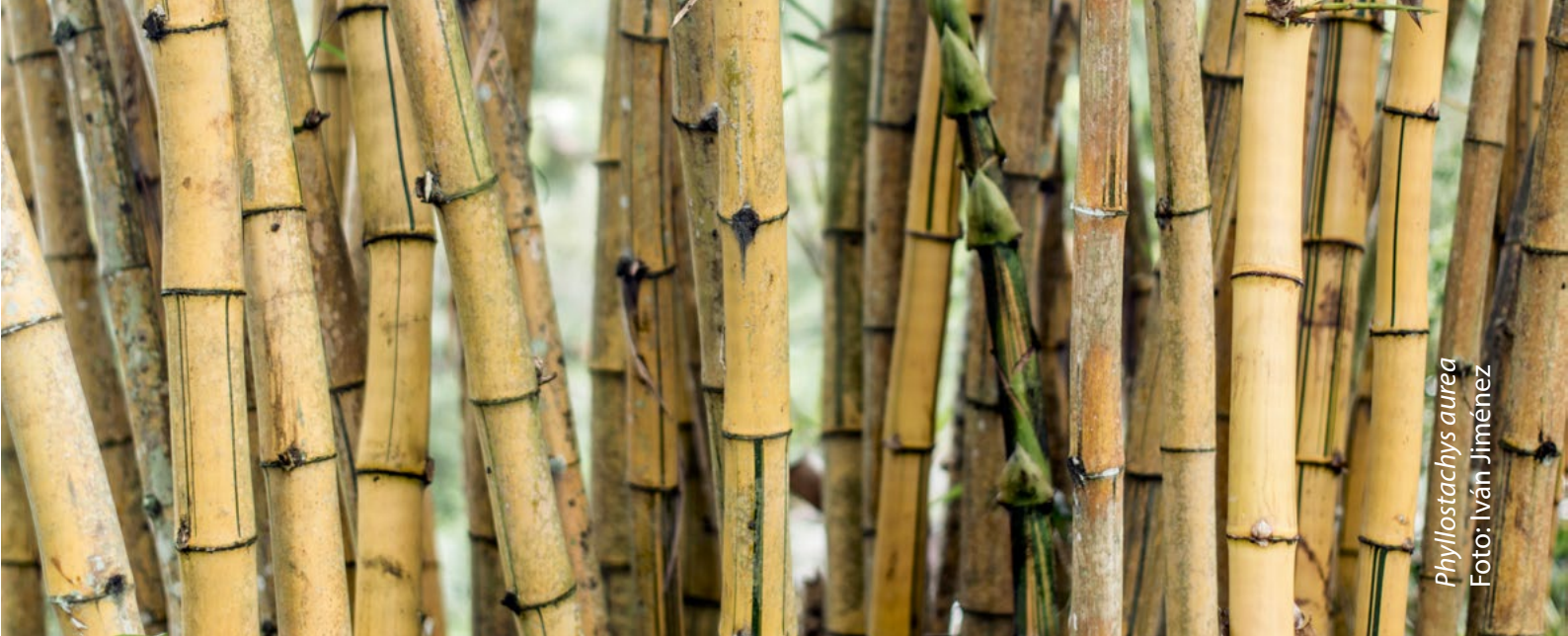
Phyllostachys aurea