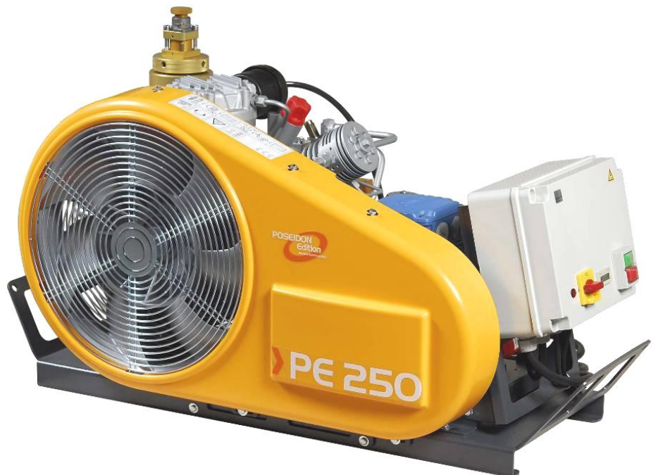
PE250-TE mit Kompressorsteuerung (Sonderausstattung)