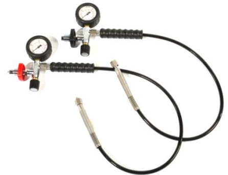
Fülleinrichtung PN200 bzw. PN300