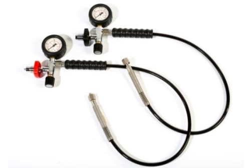
Fülleinrichtung PN200 bzw. PN300