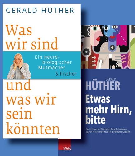
Aktuelle Buchtitel von Gerald Hüther.

Wenn Sie mehr über uns erfahren möchten, besuchen Sie uns im Internet auf www.grow.ag . Dort finden Sie auch Informationen, wie wir Sie unterstützen, diese Impulse nachhaltig in Ihrer Arbeit, Ihrem Unternehmen oder Ihrer Organisation zu implementieren.