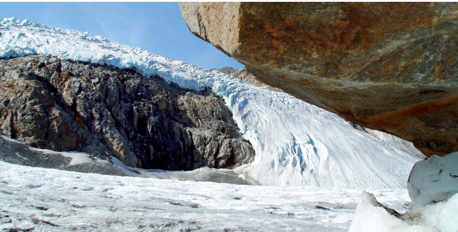
Angesichts schwindender Gletscher kann man sich fast nicht mehr vorstellen, wie sehr deren Eis die Alpenoberfläche geformt hat