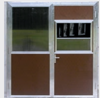
Zweiflügeltüre aus Aluminium