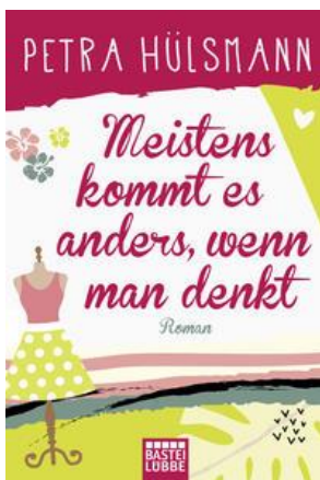
Buchcover: © buchhandel.de