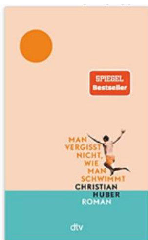
Buchcover: © buchhandel.de