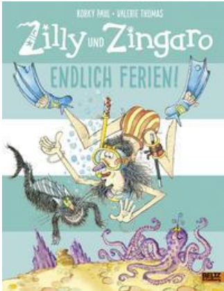
Buchcover: © buchhandel.de