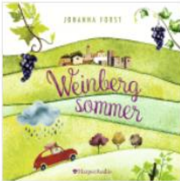
Hörbuch-Cover: © onleihe.rlp