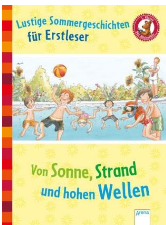
Buchcover: © buchhandel.de