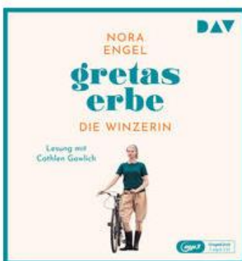
Buchcover: © buchhandel.de