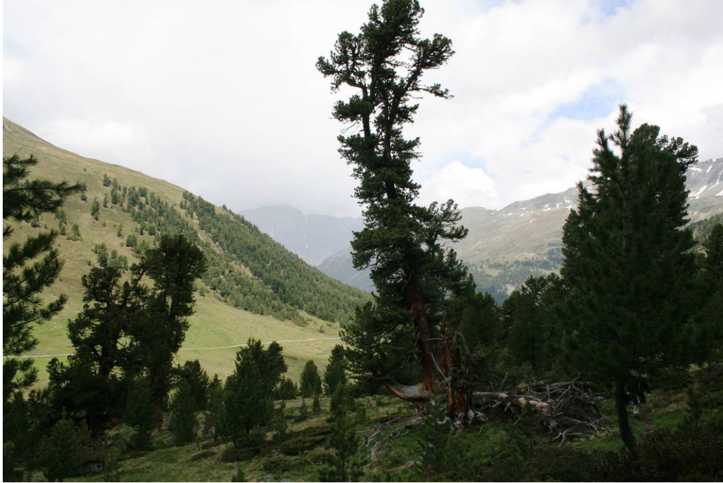
Im God Tamangur (Wald von Tamangur)