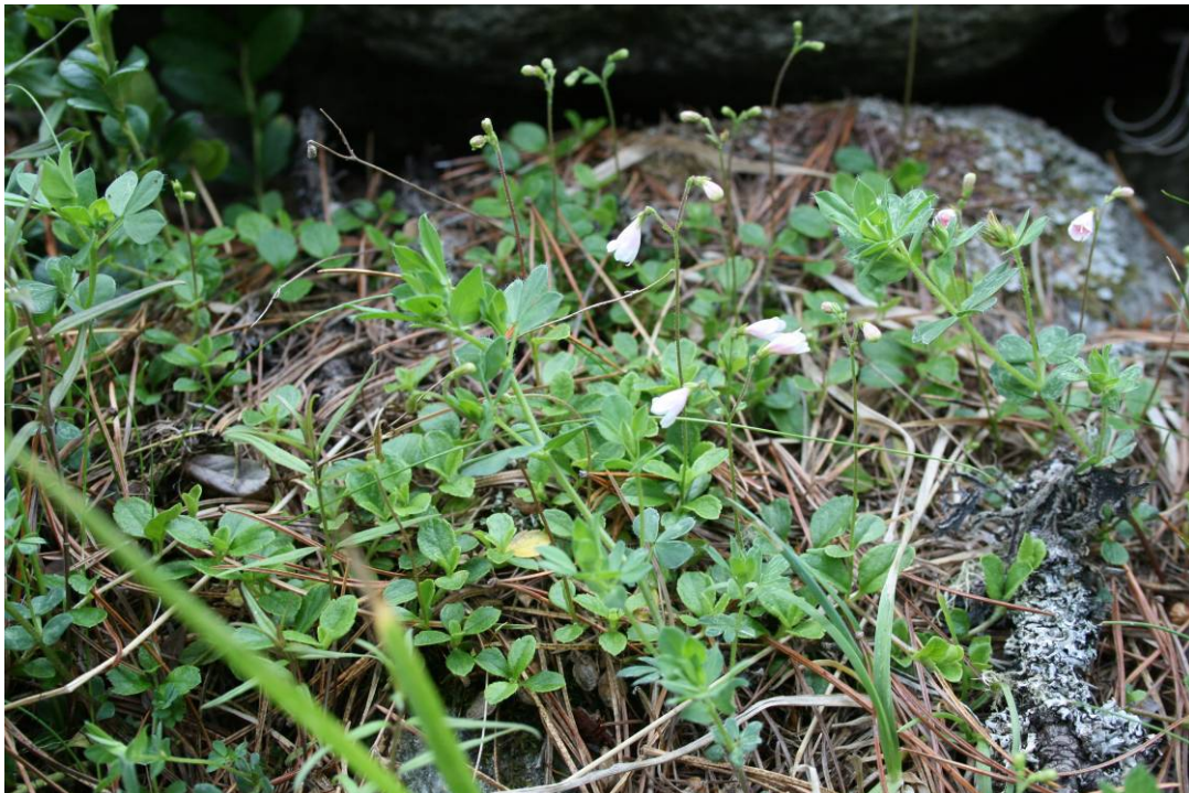
Linnaea borealis – Moosglöckchen (2009)

Berg-Nelkenwurz Pyramiden-Günsel Stengelloser Enzian Frühlings-Krokus