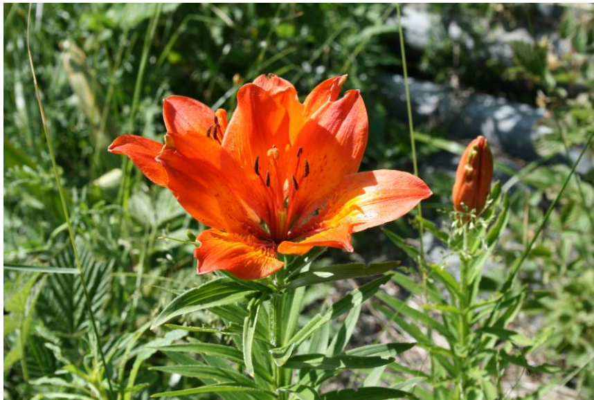
Lilium bulbiferum ssp. croceum - Bulbillenlose Feuerlilie

Mittwoch, 1. Juni 2011: Wanderung von Zernez (1473 m) nach Susch (1426 m) östlich des En (Inn)*; nachmittags Nationalparkmuseum