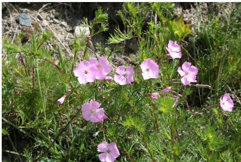
Dianthus sylvestris - Stein-Nelke

Gemeiner Sauerdorn, Berberitze Hasel Alpen-Rose Vogelbeere Trauben-Kirsche Sanddorn Purgierdorn Zitter-Pappel Trauben-Holunder