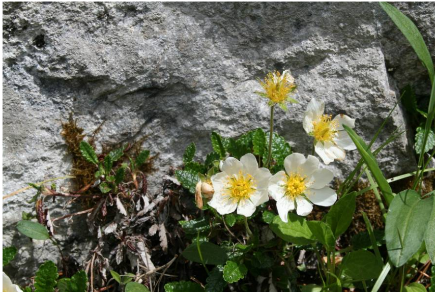
Dryas octopetala - Silberwurz

Feld-Thymian, Quendel Silberwurz Netz-Weide