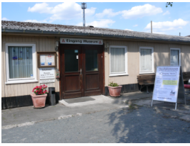
im gelben Museumsgebäude