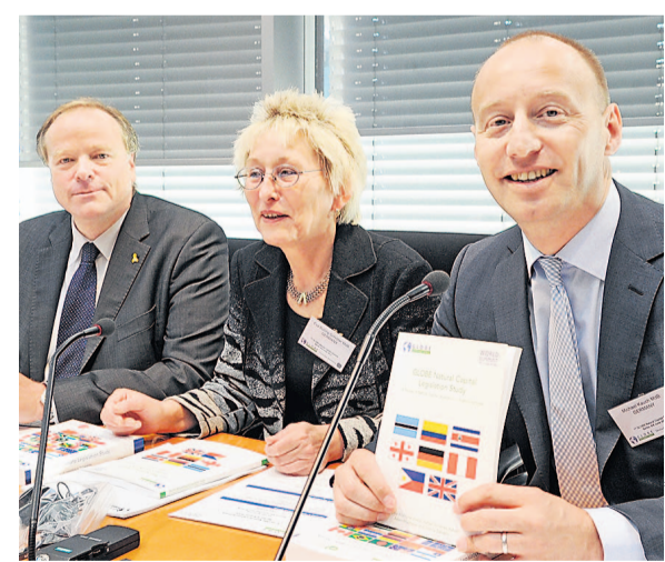
Dirk Niebel (links), Eva Bulling-Schröter und Michael Kauch (rechts) wollen der Natur einen anderen Wert geben.

Initiative trat Dirk Niebel (FDP) auf. Ziel sei nicht die „Ökonomisierung der Natur“, so der Entwicklungshilfeminister. Doch die Umwelt erbringe viele Leistung bislang gratis, und würde deren Wert berechnet, dann werde die Natur zum Bestandteil des alltäglichen Wirtschaftslebens. Der FDP-Politiker unterstrich, Nutzungs- und Schutzkonzepte für die Umwelt müssten stärker mit der Bekämpfung von Armut verbunden werden.