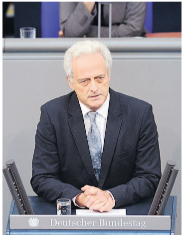
Peter Ramsauer (*1954) Bundesminister

Wir haben erst am 28. Februar dieses Jahres über diesen gesamten Themenkomplex gesprochen. Heute gilt wie am 28. Februar: Nachdem ich mir sehr aufmerksam angehört habe, wie die Oppositionsfraktionen über Deutschland und Wohnen in Deutschland sprechen, habe ich den Eindruck, sie sprechen über ein ganz anderes Land, aber nicht über unser.