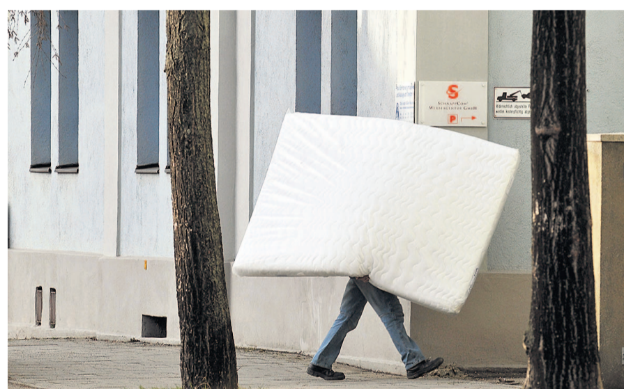
Höhere Mieten bedeuten oft Umzug.

Anträge abgelehnt Der Bundestag lehnte insgesamt vier Anträge der Oppositionsfraktionen teils in namentlicher Abstimmung ab: So hatte die SPD gefordert (17/10999), das Programm „Soziale Stadt“ zukunftsfähig weiterzuentwickeln und die Städtebauförderung zu sichern. Die Koalitionsabgeordneten votierten auch mit ihrer Mehrheit in namentlicher Abstimmung mit 306 gegen 198 Stimmen bei 63 Enthaltungen gegen den SPD-Antrag (17/12485) „Bezahlbares Wohnen in der sozialen Stadt“ und gegen den Antrag der Fraktion Die Linke (17/12481) „Wohnungsnot bekämpfen, sozialen Wohnungsbau neu starten und zum Kern einer gemeinnützigen Wohnungswirtschaft entwickeln“. Auch eine weitere Initiative der Linksfraktion „Wohn- und Mietsituation von Studierenden verbessern“ (17/11696) fand keine Mehrheit. Der Bundestag folgte dabei den Beschlussempfehlungen des Verkehrs- und Bauausschusses (17/12453, 17/13776). Michael Klein ■