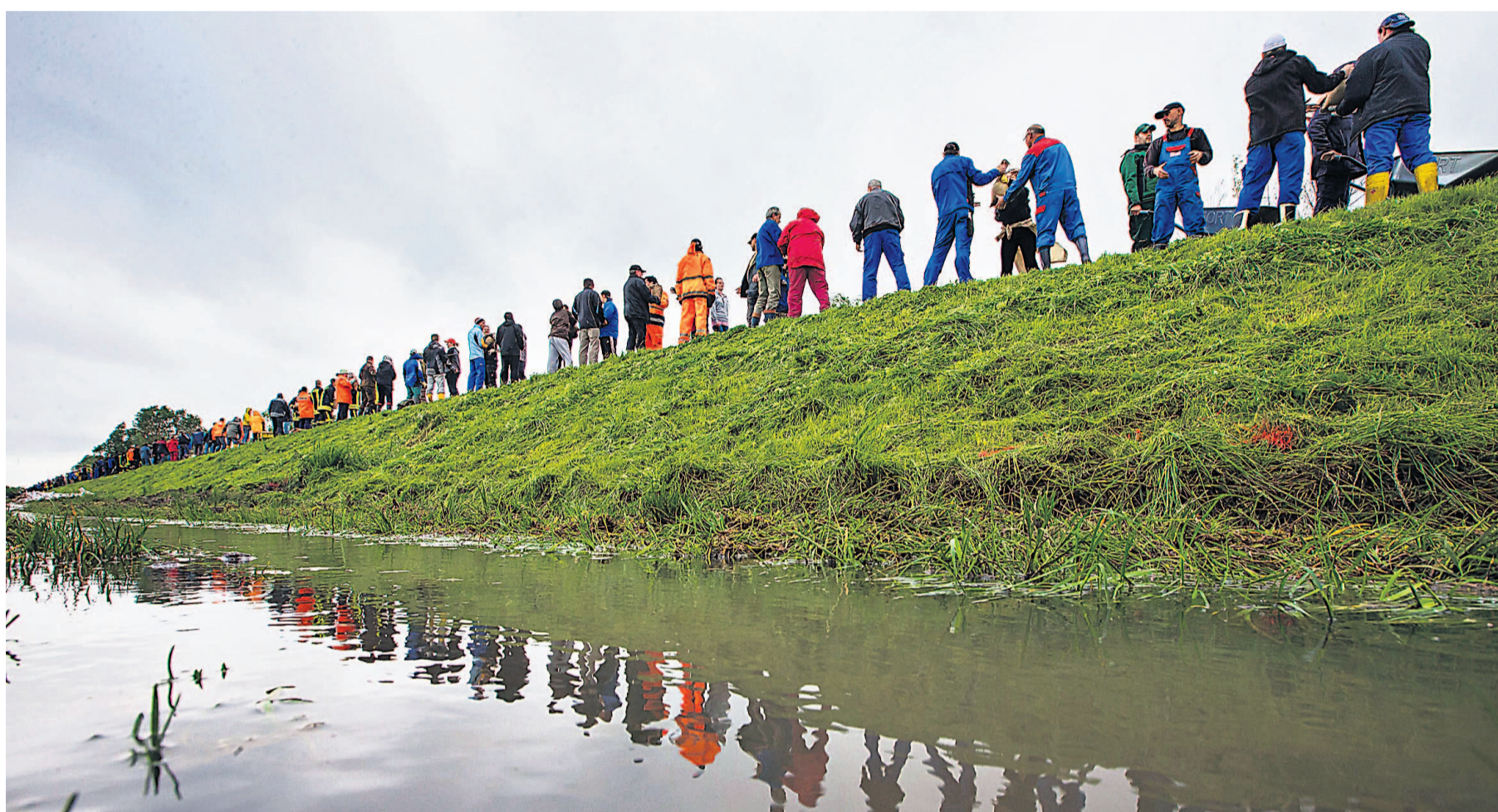
Gemeinsamkeit macht stark: Freiwillige Helfer kämpfen in Walsleben (Thüringen) mit Sandsäcken gegen den drohenden Dambruch der Gera.

Früher tief im Minus Zum Vergleich: Der Deutsche Städtetag gibt den Finanzierungssaldo für 2011 mit minus 1,67 Milliarden Euro an, für 2010 mit minus 6,87 Milliarden. „Das vielfältige finanzielle Engagement des Bundes zugunsten der Kommunen trägt maßgeblich dazu bei, dass sich die kommunale Finanzsituation derzeit wieder günstiger darstellt und auch noch weiter verbessern wird“, schreibt die Regierung. Allerdings würden die weiterhin zu erwartenden starken Schwankungen des Finanzierungssaldos auf eine strukturelle Schwäche des kommunalen Steuersystems hinweisen. So seien die Defizite früherer Jahre wesentlich auf Einbrüche bei den Gewerbesteuer-