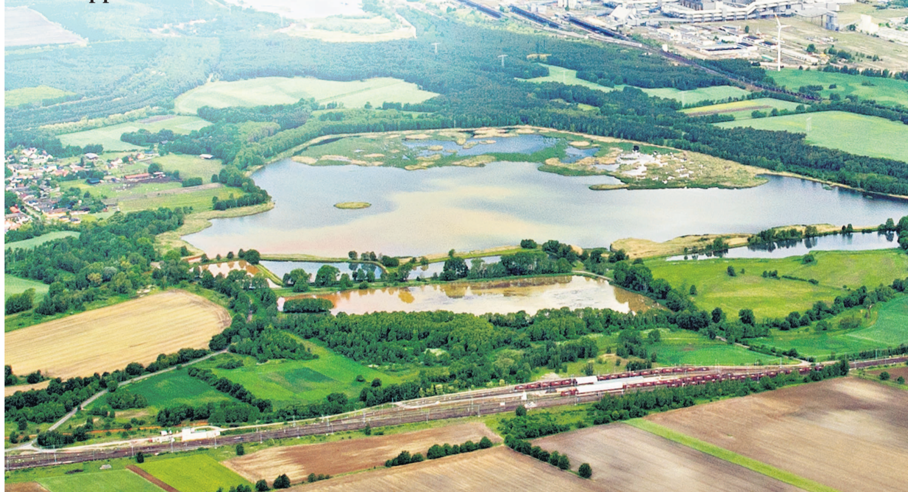
Braunkohleabbau wie hier in der Lausitz ist ein Beispiel für das schwierige Verhältnis von Wirtschaftswachstum und Umweltschutz, wie es in der Kommission diskutiert wurde.

ENQUETE Bundestag liefert sich Schlagabtausch über Wachstumspolitik. Die Debatte über den Kommissionsbericht bringt die Differenzen zwischen Koalition und Opposition zum Vorschein