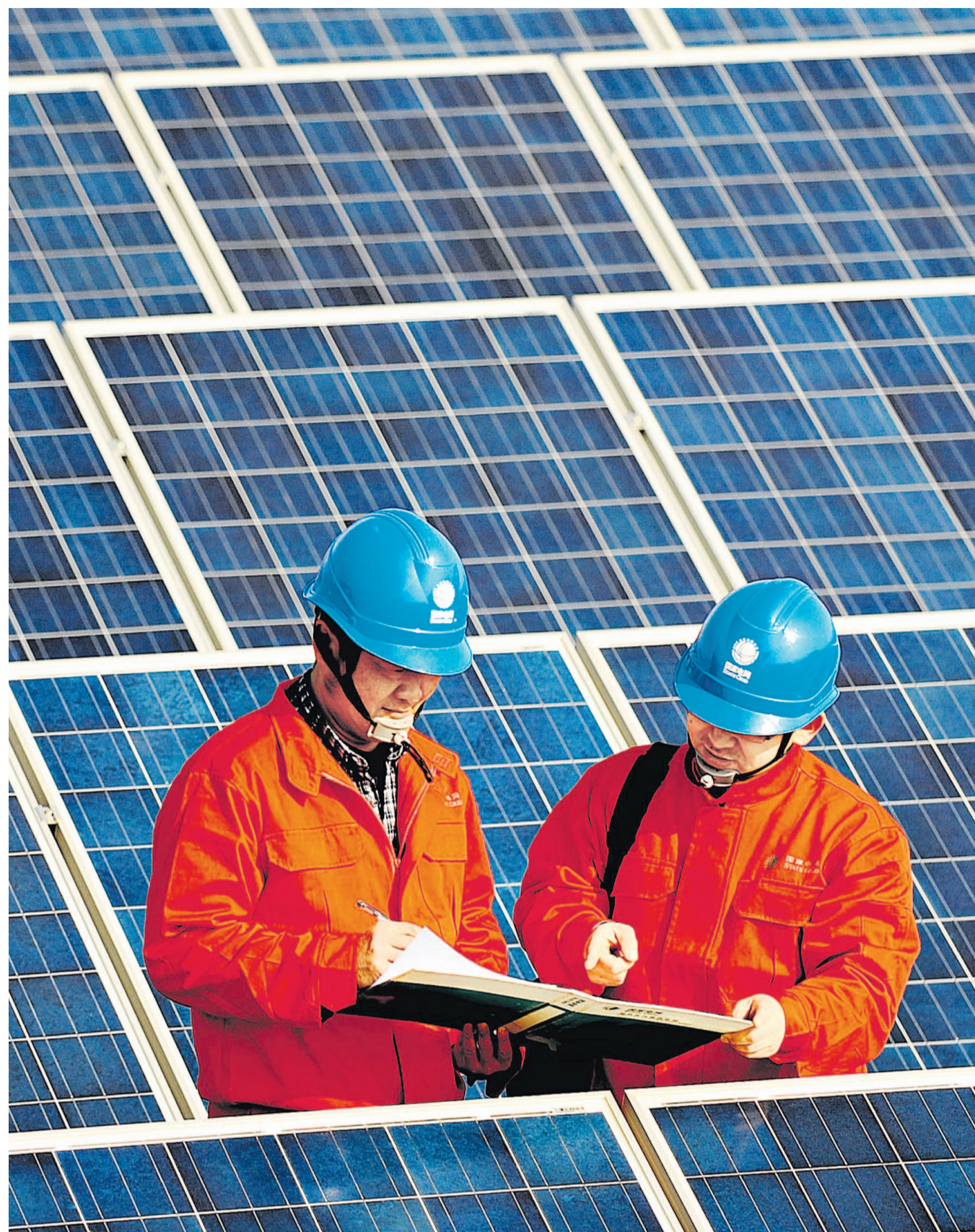
China exportiert zur Zeit Solarmodule im Wert von 21 Milliarden Euro in die Europäische Union.

Der EVP-Abgeordnete Andreas Schwab (CDU) kritisierte im Anschluss an die Anhörung, dass Mimica mit seinen Aussagen „sehr vage“ geblieben sei. Obgleich Mimica nur eine kurze Zeit von 16 Monaten, da die Amtszeit der Kommission im Jahr 2014 endet. Um dem neuen EU-Mitglied Kroatien ein eigenes Ressort überlassen zu können, wurde das bisherige Amt für Gesundheit und Verbraucherschutz aufgespalten. Mimica ist derzeit stellvertretender Regierungschef seines Landes. Der Diplomat war maßgeblich an den Beitrittsverhandlungen seines Landes mit der EU beteiligt. Er studierte in Zagreb Wirtschaftswissenschaften, arbeitete im Außenhandel, veröffentlichte aber auch eine Reihe wissenschaftlicher Publikationen zu diesem Thema. Der Sozialdemokrat gilt daher als international äußerst gut vernetzt.