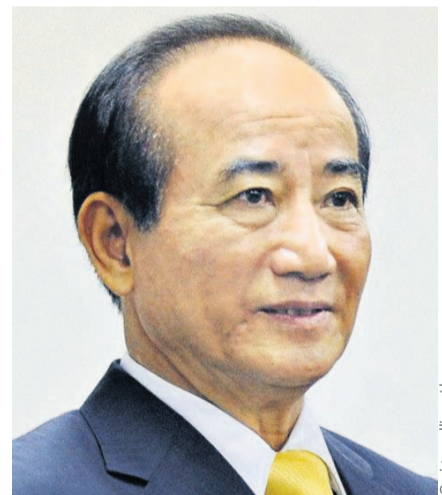
Der taiwanische Parlamentspräsident Jin-Pyng Wang

Die wirtschaftliche Entwicklung Asiens stellt sich zurzeit außerordentlich günstig dar. 1980 betrug der Anteil Asiens nicht einmal ein Fünftel der Weltwirtschaftsleistung, heute sind es bereits ein Drittel. Im Vergleich zu den USA und der EU sind sowohl die Arbeitslosenquote als auch die Inflationsrate relativ niedrig. In der Zukunft wird sich der Schwerpunkt der Weltwirtschaft womöglich nach Asien verlagern. Wenn sich die gegenwärtige Entwicklung bis 2015 fortsetzt, wird die Wirtschaftsleistung von Asien genauso groß sein wie die der USA und Europas zusammen. Tai-