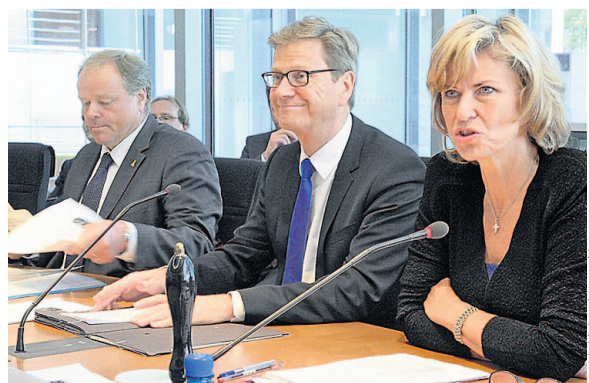
Die Minister Dirk Niebel (links) und Guido Westerwelle und die Ausschussvorsitzende Dagmar Wöhr

Perspektive für Ortskräfte Beide Minister sicherten zu, afghanische Ortskräfte nach Abzug der ISAF-Truppen nicht im Stich zu lassen. Westerwelle sprach von einer „komplizierten Abwägungsfrage“, einerseits gelte es, die Ortskräfte vor einer möglichen Gefährdung zu schützen, andererseits dürfe es nicht zu einer massenhaften Abwanderung von Verantwortungsträgern ins Ausland kommen. ahelpa