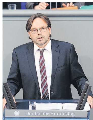
Michael Groß (*1956) Wahlkreis Recklinghausen II

Ich bin regelrecht dankbar für die Nachfragen, weil dadurch noch einmal deutlich wurde, dass es den Strang, an dem wir alle gemeinsam ziehen sollten, gar nicht gibt. Wir wüssten auch gar nicht, in welche Richtung wir gemeinsam ziehen sollten.