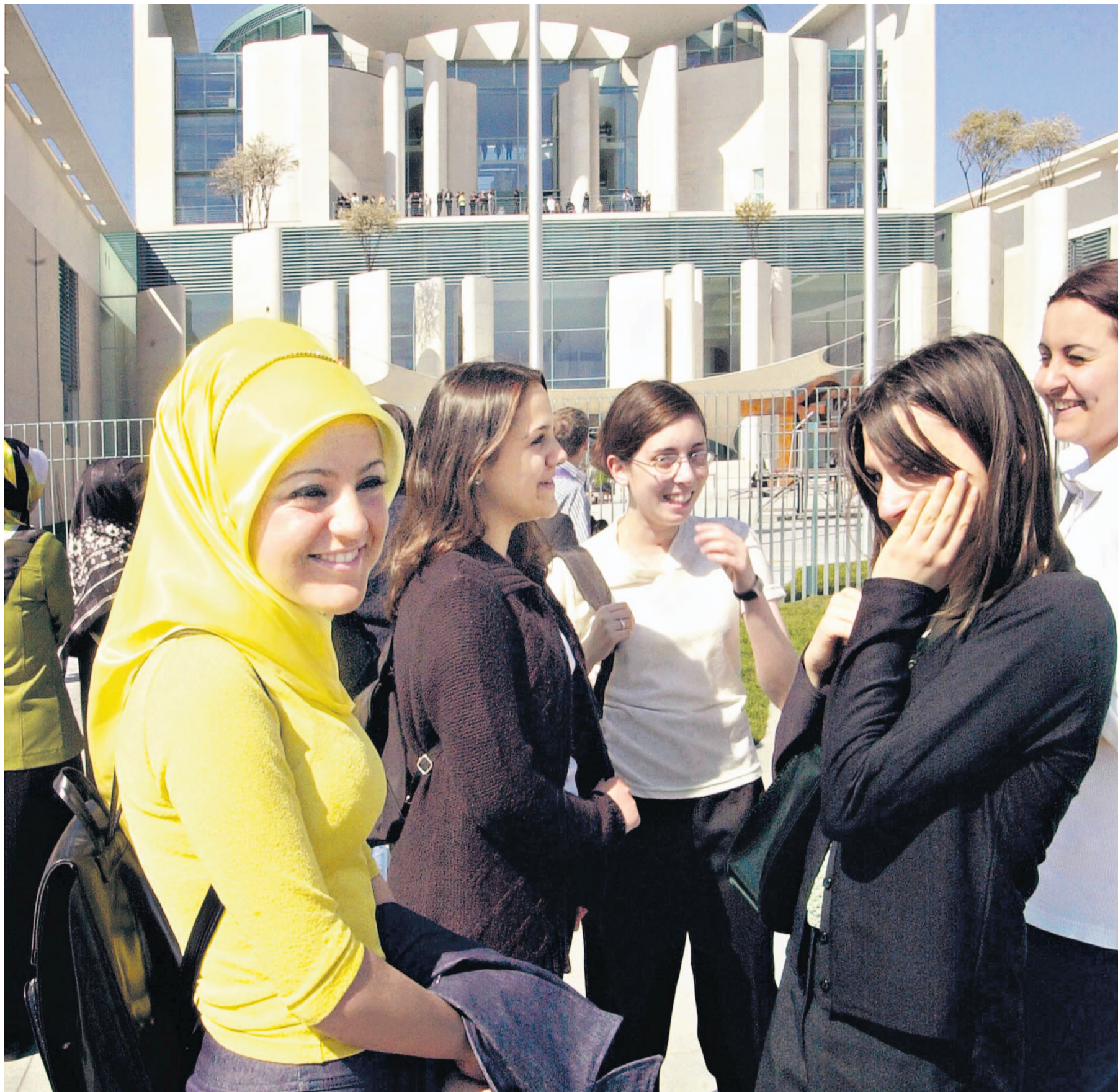
Deutsche Schülerinnen türkischer Herkunft vor dem Kanzleramt. Bis zum 23. Lebensjahr müssen sich viele junge Deutsche mit ausländischen Wurzeln für einen Pass entscheiden.