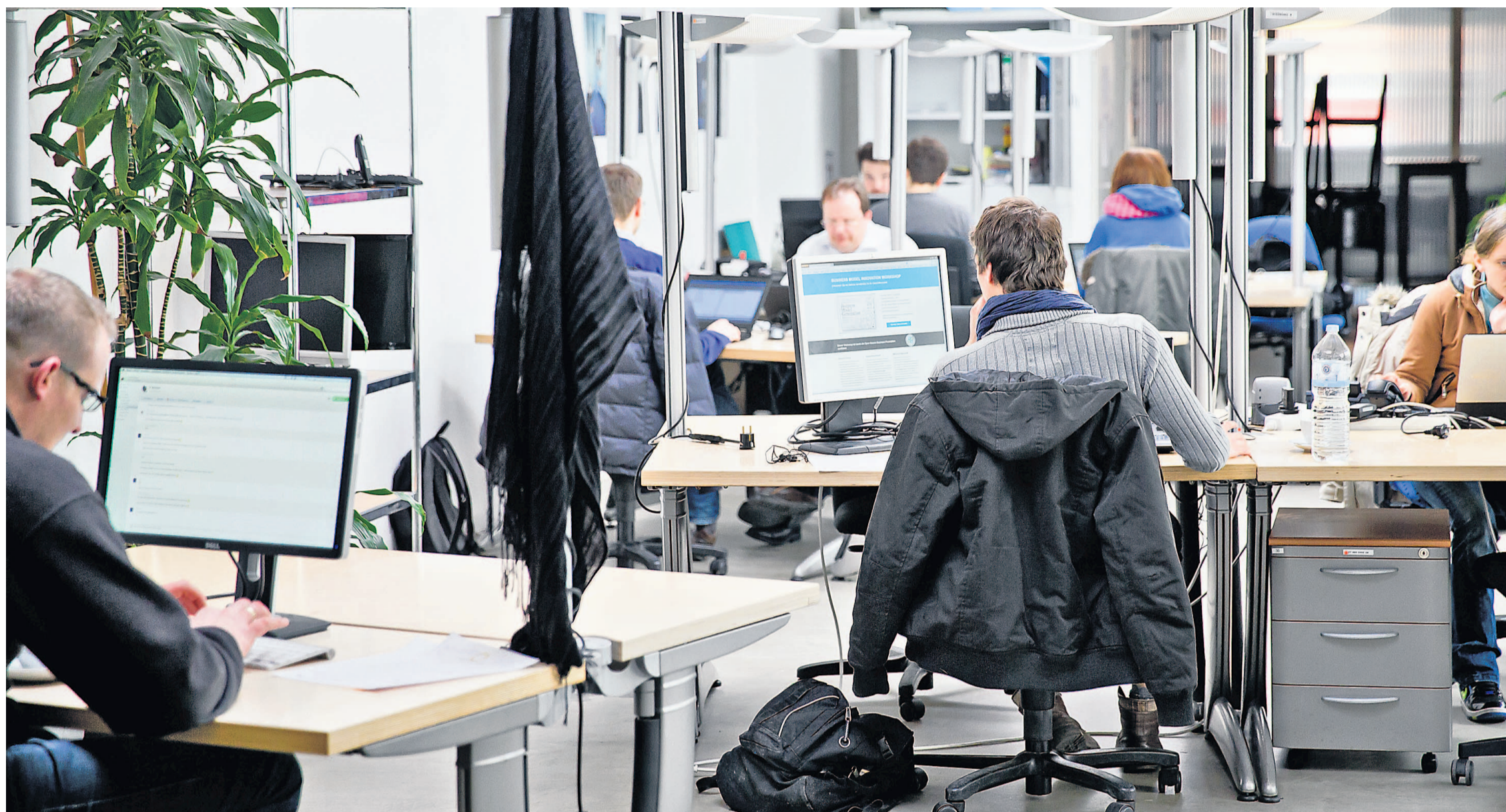
Das Arbeiten an gemieteten Büroarbeitsplätzen („Coworking“) ist für viele Kreative die einzige Möglichkeit, an der digitalen Welt teilzunehmen.