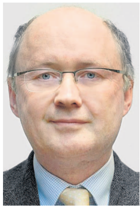
Manfred Schäfers »Frankfurter Allgemeine Zeitung«