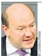
»Ohne die Freien Berufe wäre unser Land ärmer.« Kai Wegner (CDU)