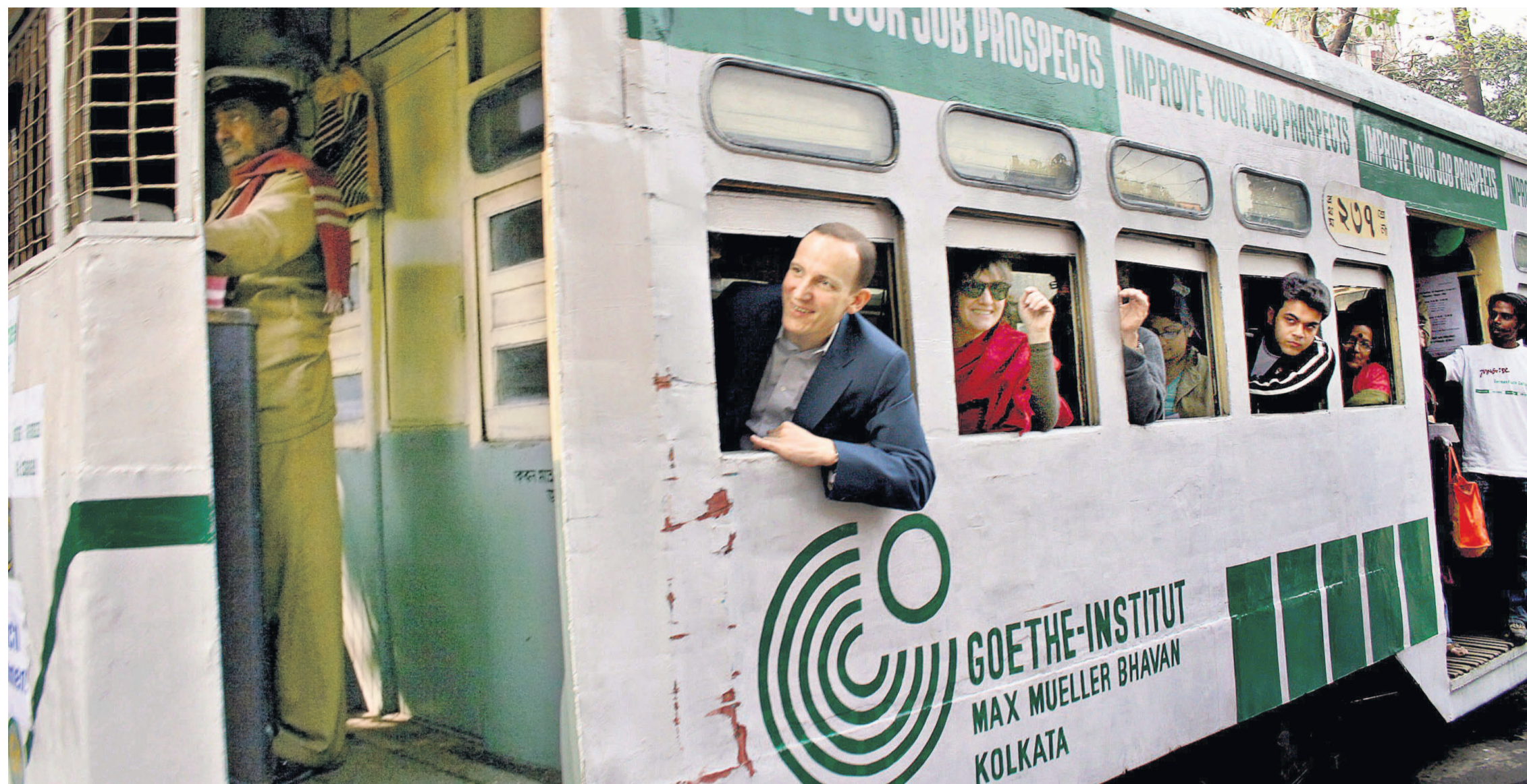
Zum Sprachkurs mit der Straßenbahn: Werbeaktion des Goethe-Instituts im indischen Kalkutta

Der SPD-Fraktionsvorsitzende Frank-Walter Steinmeier nannte die Entscheidungen des Gerichts „völlig inakzeptabel und zutiefst beunruhigend“. Die Urteile seien eine schwere Belastung für die bilateralen Beziehungen und nicht hinnehmbar. ahelpa