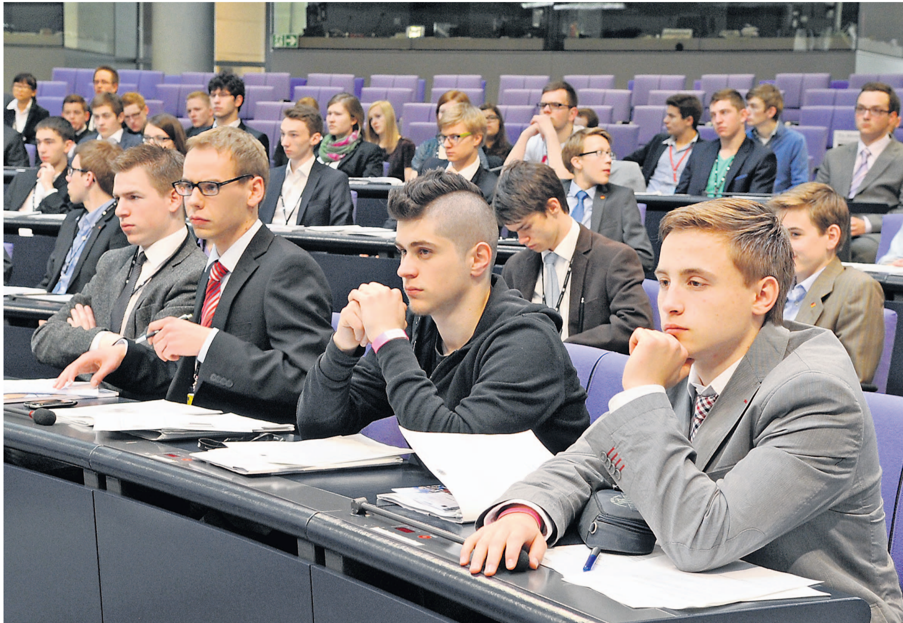
Teilnehmer des Planspiels „Jugend und Parlament“ debattierten im Bundestag ihre selbst ausgearbeiteten Gesetzesentwürfe wie richtige Abgeordnete.