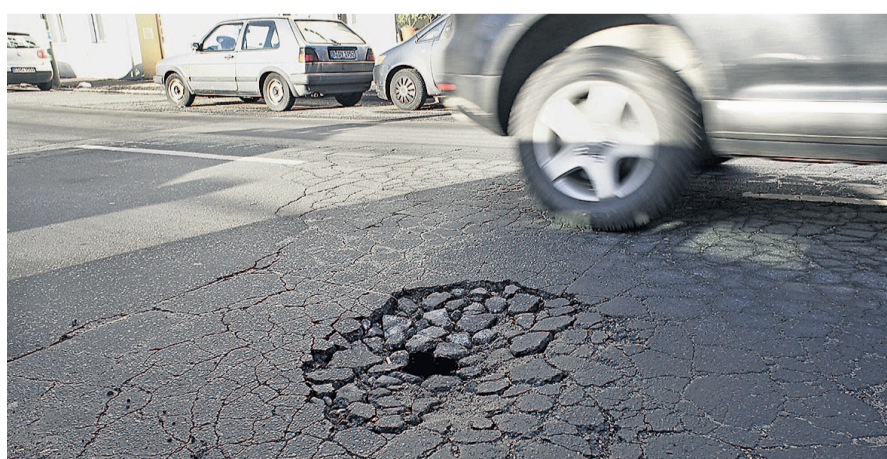
Schlaglöcher sind ein sicheres Indiz für leere kommunale Kassen.

einnahmen zurückzuführen. Auch die aktuelle positive Entwicklung beruhe auf starken Zuwächsen bei der Gewerbesteuer. „Ein stetiges kommunales Steuersystem hätte den Kommunen dieses Auf und Ab erspart“, schreibt die Regierung. Die Gewerbesteuererinnahmen schwanken sehr stark. Im vergangenen Jahr betrugen sie 32,3 Milliarden Euro, während es 2010 nur knapp 27 Milliarden Euro waren. Bei den