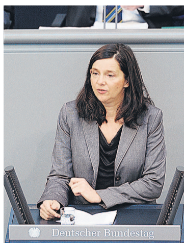
Katrin Göring-Eckardt (*1966) Bundestagsvizepräsidentin

erneut müssen viele Menschen gegen massives Hochwasser kämpfen. Unser Dank gilt den vielen Helferinnen und Helfern: denen von den Freiwilligen Feuerwehren, denen von der Bundeswehr, denen, die ehrenamtlich helfen, den Nachbarinnen und Nachbarn. Viele Notunterkünfte wurden gar nicht gebraucht, weil die Menschen bei Freunden, bei Nachbarn, zum Teil auch bei ganz Fremden untergekommen sind.