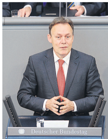
Thomas Oppermann (*1954) Wahlkreis Göttingen

Herr Präsident, ich möchte Ihnen für die einfühlsamen und richtigen Worte danken, die Sie zur Flutkatastrophe gefunden haben. In der Tat: Das ist kein Thema für parteipolitische Auseinandersetzungen. In diesem Moment sollte der Bundestag insgesamt zusammenstehen und klarmachen, dass wir die Flutopfer nicht alleine lassen, dass wir alle möglichen Hilfen gewähren, die jetzt benötigt werden.