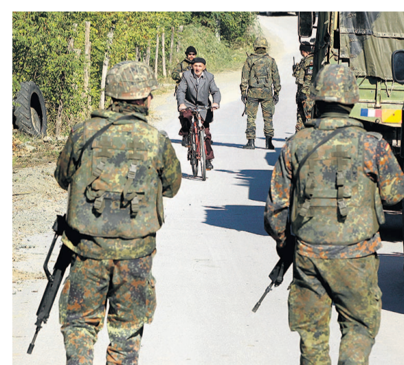
Bundeswehrsoldaten beim Einsatz im Norden Kosovos

Der Außenminister versucht es mit vorsichtigem Optimismus: Die erste Einigung zwischen Kosovo und Serbien auf eine Normalisierung ihrer Beziehungen vor wenigen Wochen sei eine „bedeutende politische Entwicklung“, sagte Guido Westerwelle (FDP) am vergangenen Freitag bei der ersten Beratung zur Verlängerung des Bundeswehreinsatzes im Norden des Kosovo.