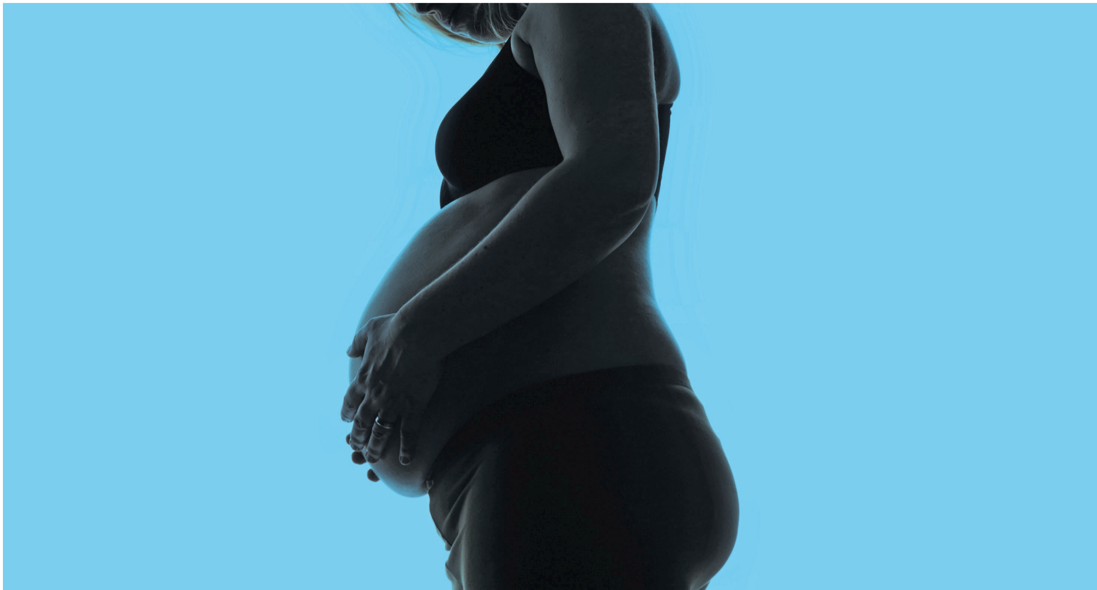
Nicht für alle Frauen stellt eine Schwangerschaft einen Glücksfall dar: Frauen in Notsituationen können zukünftig ihr Kind vertraulich entbinden.