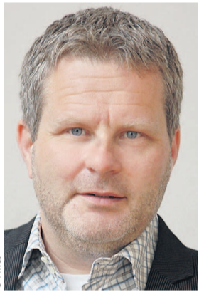
Claus Hulverscheidt »Süddeutsche Zeitung«