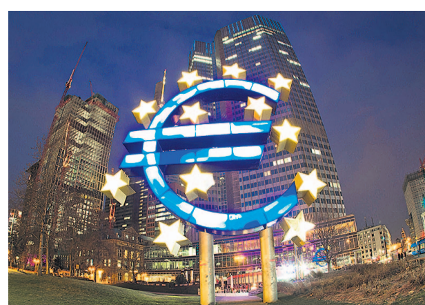
Wächter des Geldes: Europäische Zentralbank in Frankfurt

dem Prinzip „ein Land eine Stimme“ erfolgen solle. Das seien sehr sonderbare Machtverhältnisse. „Es besteht das Risiko, dass die