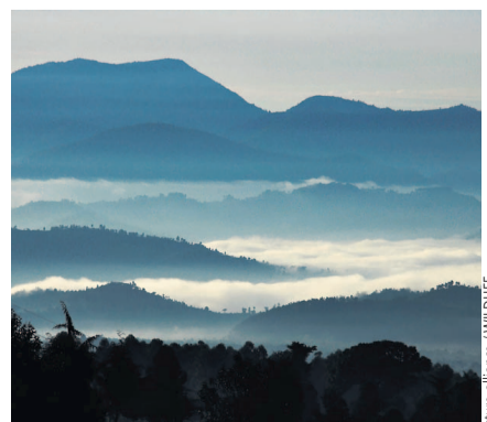
Blick auf die Virunga-Vulkane im Osten der Demokratischen Republik Kongo

Demokratische Republik Kongo mit dem Ziel einzuwirken, dem Biodiversitäts- und Waldschutz oberste Priorität einzuräumen. Weiterhin soll sie gegenüber der Regierung in Kinshasa dafür eintreten, vom „vorliegenden Gesetzentwurf zur Legalisierung von Ölbohrungen in Schutzgebieten Abstand zu nehmen“. Die kongolesische Seite soll ferner darin unterstützt werden, „nachhaltige Lösungen für drängende Entwicklungsfragen zu finden, die den künftigen Schutz der Nationalparks und Schutzgebiete nicht in Frage stellen“. ahelpa