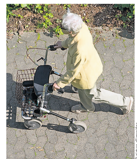
Ältere sollen nicht in Armut leben müssen

Der Vorschlag der Grünen, eine steuerfinanzierte Garantierente zu schaffen, findet keine Unterstützung im Bundestag. Während der ersten Lesung eines entsprechenden Antrages (17/13493) der Fraktion am vergangenen Donnerstag gab es nicht nur Kritik von Seiten der Koalition sondern auch von SPD und Linken.