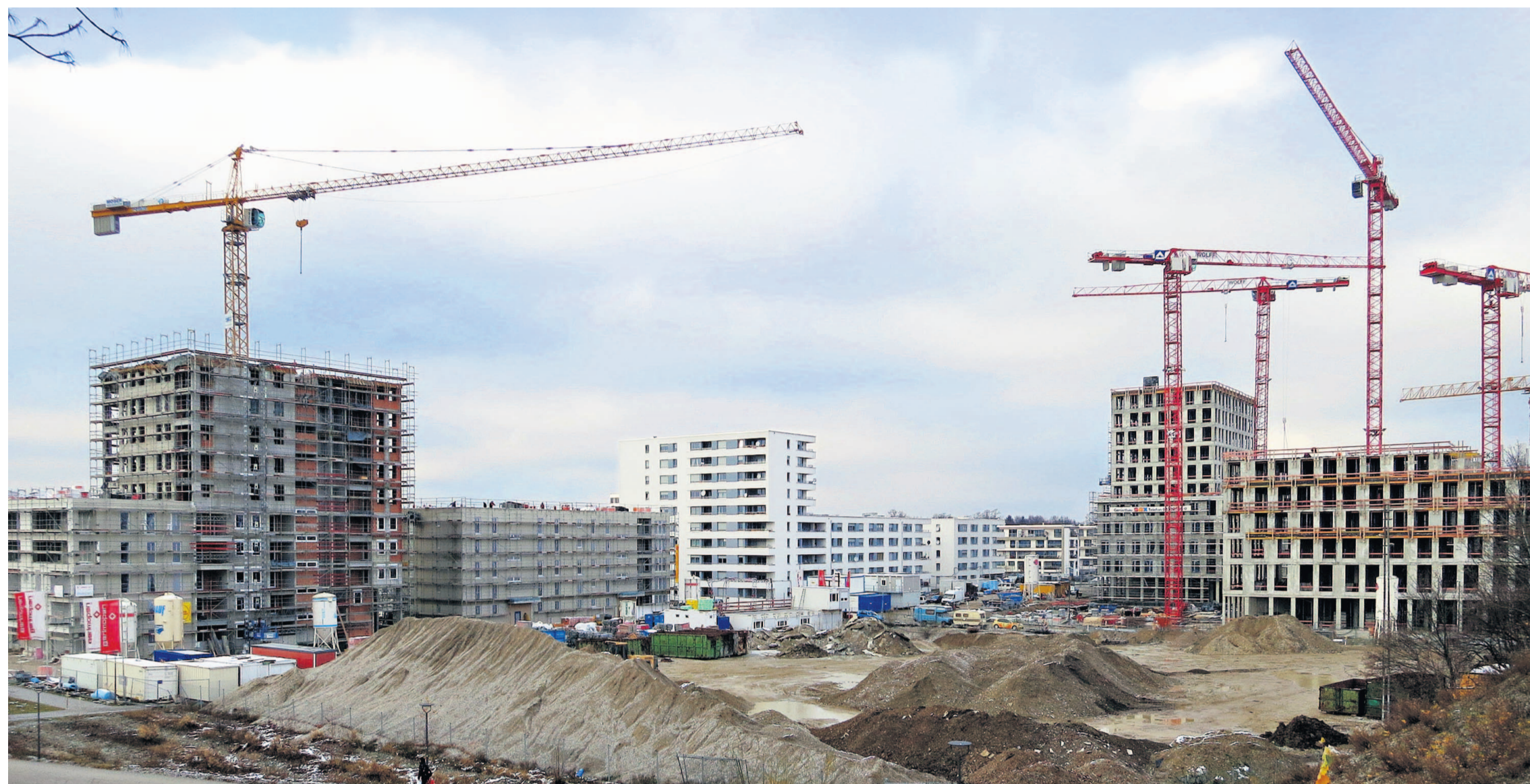
Vorzeigeprojekt in München: Eigentums- und Sozialwohnungen werden nebeneinander gebaut.

Die Bundesregierung soll die Obdach- und Wohnungslosigkeit erkennen und bekämpfen. Dies fordert die Fraktion Die Linke in einem Antrag (17/13105), der am Freitag erstmals beraten wurde. Deshalb soll die Regierung die Grundlage für bundesweite Wohnungslosenstatistiken schaffen und besonders den sozialen Wohnungsbau bedarfsgerecht sichern. Die Obdachlosigkeit soll weiter wissenschaftlich untersucht werden. Modellprojekte zum Bau von neuem Wohnraum sollen mit Hilfe der von Obdachlosigkeit Betroffenen nicht nur Wohnraum, sondern auch soziale Verantwortung und Arbeit gleichzeitig schaffen. mik ■