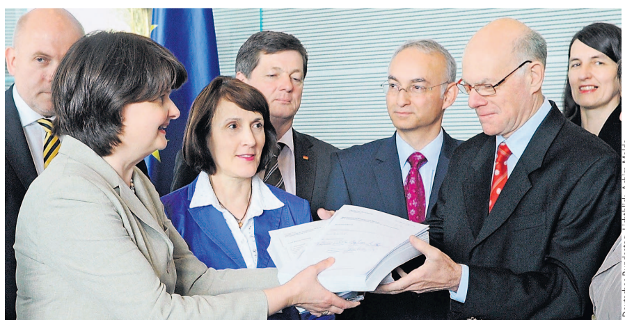
Die Ausschussvorsitzende Maria Flachsbarth (links) bei der Übergabe des Berichts an Bundestagspräsident Norbert Lammert (rechts, beide CDU).

Anderer Meinung war Dorothee Menzner (Die Linke). Sie warf der Regierung vor, sie habe das Regierungshandeln der Vergangenheit „reinwaschen“ wollen. Der Standort Gorleben hätte gegen alle Bedenken „durchgeboxt“ werden sollen. Aus den Unterlagen der Opposition könne man ablesen, dass über Jahrzehnte ein echtes Konzept für die Lagerung dieser gefährlichen Stoffe, „die die Menschheit je hervorgebracht hat“, gefehlt habe. Im Gegensatz zum Gesetzentwurf für