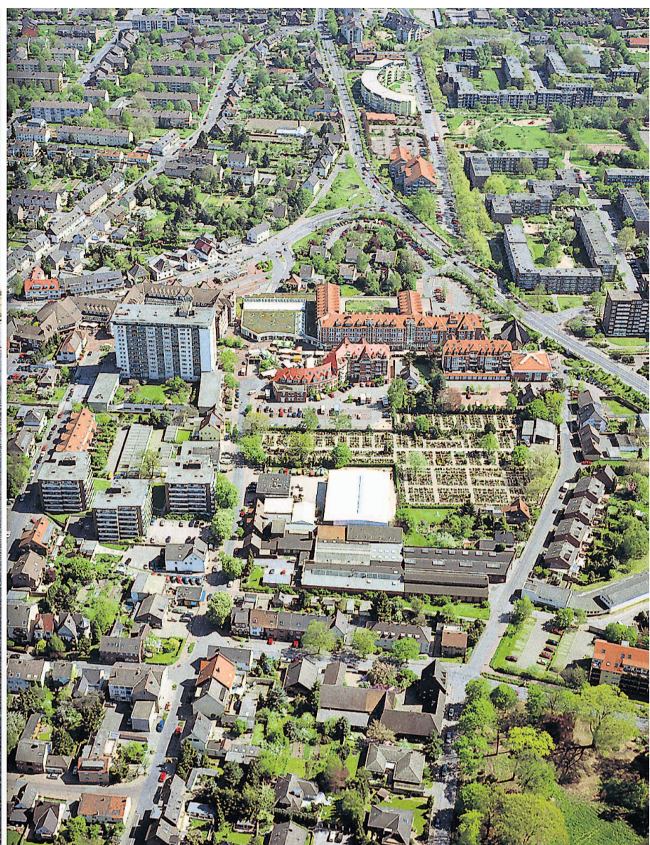
Die Idylle kann trügen: In der schönen Eifelstadt Nideggen (links) regiert der Sparkommissar und vor dem Schloss in Schwerin (Mitte) klaffen Schlaglöcher. Das rheinische Monheim wetteifert derweil um möglichst niedrige Gewerbesteuern, um die klammen Kassen zu füllen.