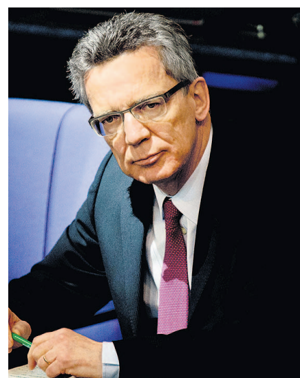
Unter Druck: Minister de Maizière

den Abbruch des Projektes auf Staatssekretärebene gefällt und später von ihm gebilligt worden seien. Gleichzeitig räumte er ein, es versäumt zu haben, „im Rüstungsbereich das Ministerium so zu organisieren, dass ich frühzeitig selbst von Problemen erfahre. Personelle Konsequenzen oder seinen Rücktritt lehnte der Minister in der vergangenen Woche ab.