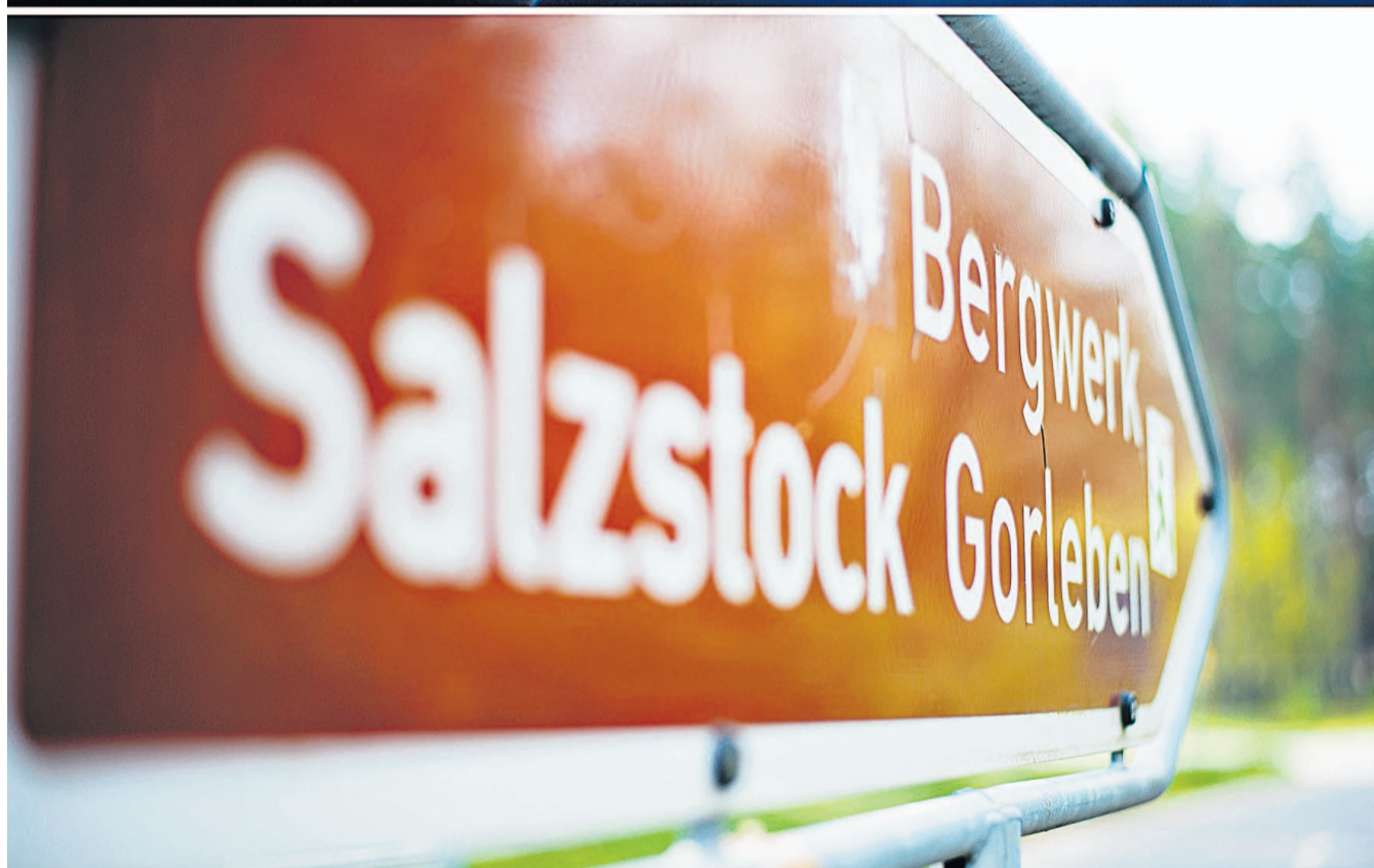
Zum Atommülllager Gorleben gehört neben dem Lager für Castor-Behälter auch das Bergwerk im Salzstock.