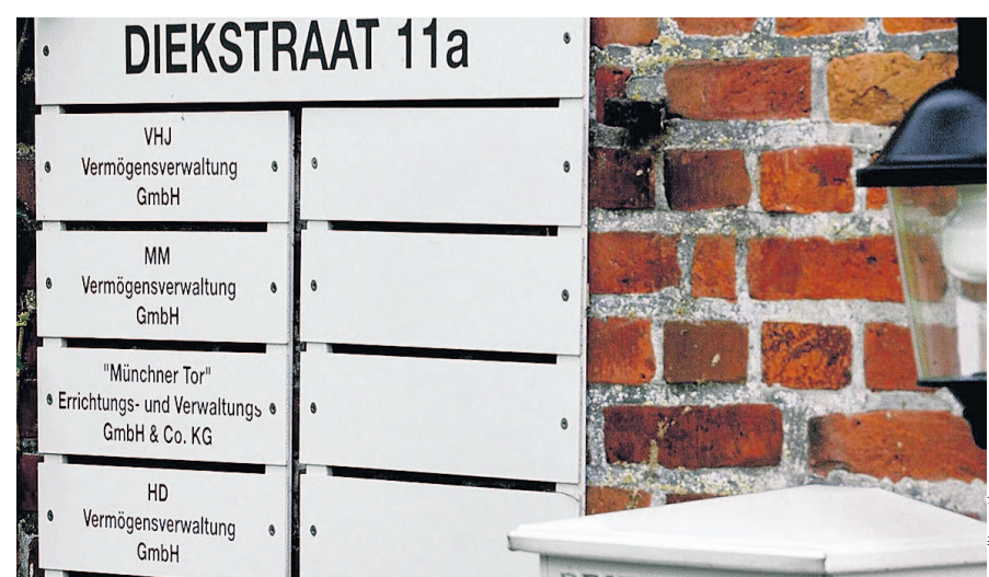
Ein deutsches „Steuerparadies“ mit Briefkastenfirmen war Norderfriedrichskoog in Schleswig-Holstein. Die dortige Gewerbesteuerfreiheit wurde aber wieder abgeschafft.

Gerhard Schick (Bündnis90/Die Grünen) stellte die Überlegungen in den Vordergrund, wie großen, global agierenden Konzernen die Strategie der Steuervermeidung erschwert werden könne. Sie müssten offen legen, „in welchem Land sie wie viel Gewinne gemacht und wie viel Steuern sie dafür bezahlt haben“. Die Debatte fußte auf einem Gesetzentwurf und zwei Anträgen, die zur weiteren Beratung an die Ausschüsse überwiesen wurden. Der Gesetzentwurf der Koalition (17/13704) hat den Ausbau der Zusammenarbeit mit den USA bei der Bekämpfung der Steuerhinterziehung zum Ziel. Die SPD-Fraktion verlangt in einem Antrag (17/13716) Maßnahmen zur Verhinderung globaler Steuergestaltung und zum Stopfen von Regulierungslöchern. SPD und Grüne heben in einem gemeinsamen Antrag (17/13717) darauf ab, multinationale Unternehmen zur Offenlegung ihrer Steuerzahlungen in den verschiedenen Ländern zu verpflichten. fla