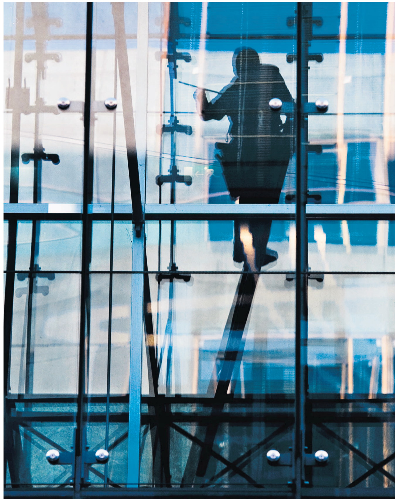
Sie haben schon einen Branchenmindestlohn: Glas- und Fassadenreiner verdienen mindestens elf Euro (West) oder neun Euro (Ost).