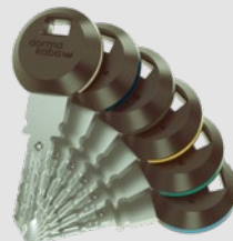
Bei den RFID-Transponder-Clips erleichtern 6 farbige Ringelemente die Orientierung.