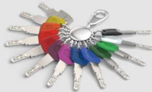
Der Schlüssel mit Largekey-Clip ist ebenfalls in 12 Farben verfügbar.