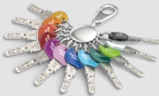
Für den Standardschlüssel gibt es Smartkey-Clips in 12 Farben.