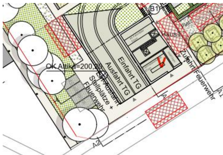
Abbildung 2: Pkw-Stellplätze Außenbereich