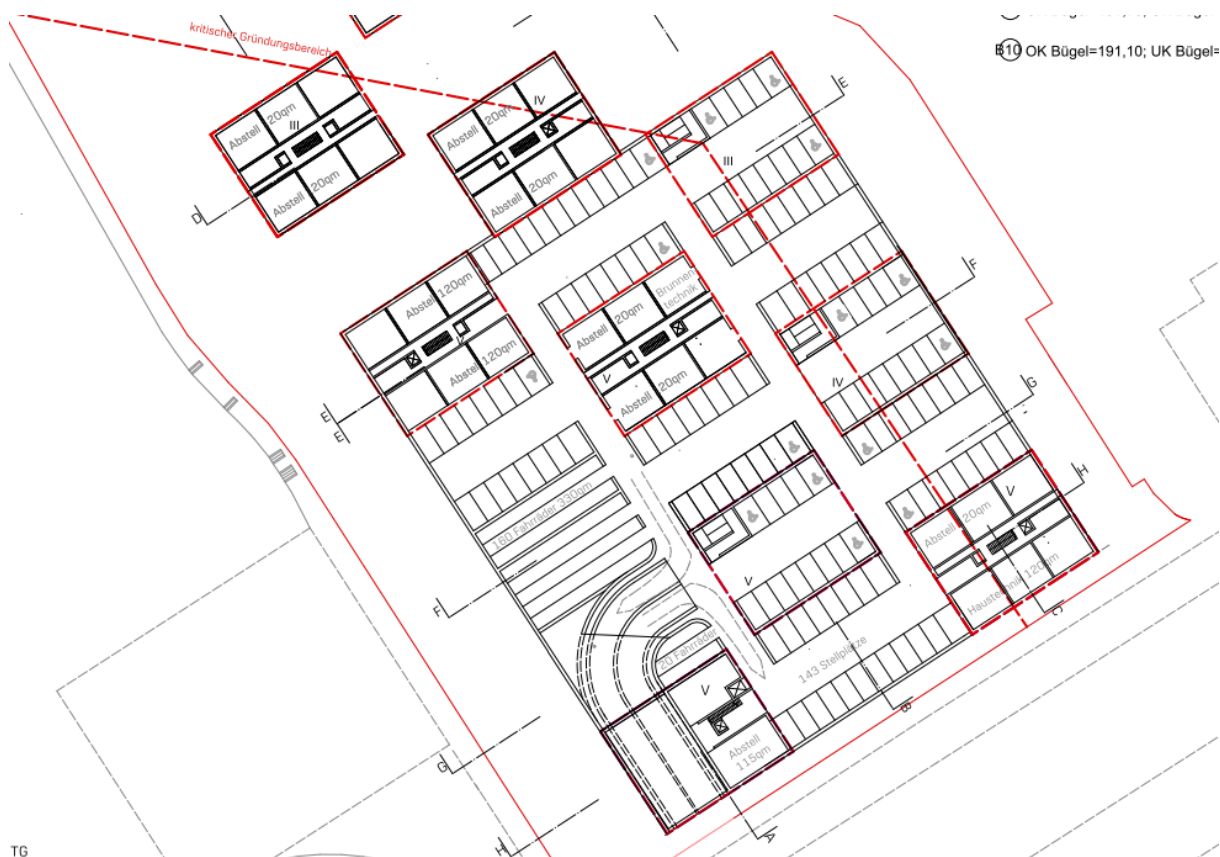
Abbildung 1: Übersicht Pkw-Stellplätze Tiefgarage