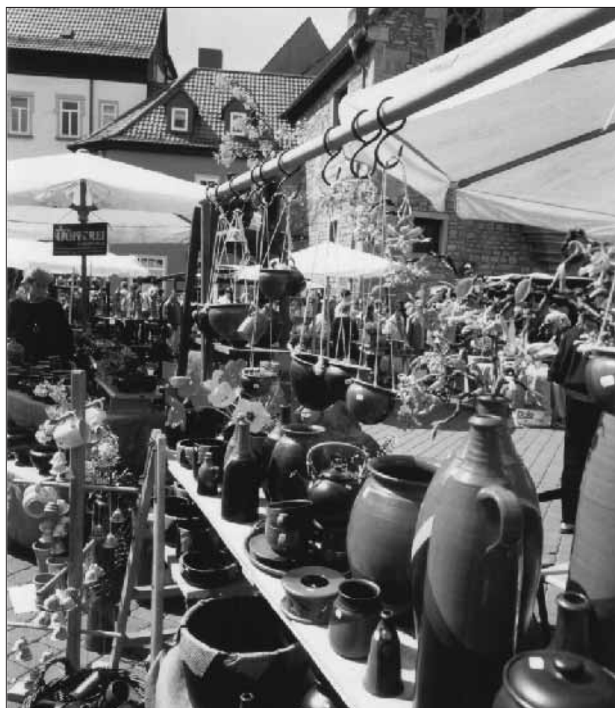
Bereits zum 14. Mal gibt es parallel zum Autofrühling in unserer historischen Altstadt zwischen Fischmarkt und Wenigemarkt vom 21. bis 22. April den Erfurter Töpfermarkt.

Die nächste öffentliche Sitzung des Ausländerbeirates ist am 21. Mai um 17 Uhr im Erfurter Rathaus.