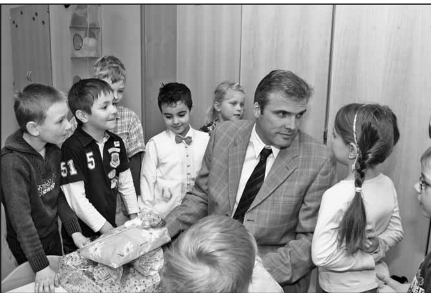
Fragen an den Oberbürgermeister.