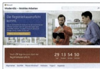
MICROSOFT. Dieser Tage geht ein Webportal online, auf dem zahlreiche Microsoft-Partner ihre Lösungen zeigen.

Ob Nachrüstung oder Neuanschaffung günstiger ist, entscheidet sich im Einzelfall. Was ab 1. Jänner 2016 keinesfalls mehr zugelassen ist, sind mechanische Kassensysteme, aus denen sich die Daten nicht elektronisch exportieren lassen.