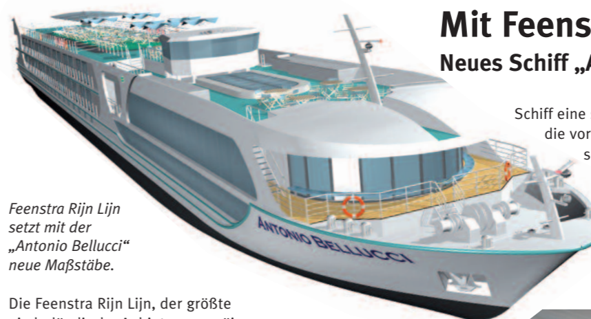
Feenstra Rijn Lijn setzt mit der „Antonio Bellucci“ neue Maßstäbe.

Die Feenstra Rijn Lijn, der größte niederländische Anbieter europäischer Flusskreuzfahrten, ist auf den Flüssen Rhein, Main, Donau, Mosel, Neckar und Saar zu Hause. Mit 58 verschiedenen Reiseprogrammen und über 130 Flusskreuzfahrten im Jahr, hat die Feenstra Rijn Lijn die Niederlande, Belgien, Deutschland, Österreich, Schweiz, Ungarn und die Slowakei im Angebot.