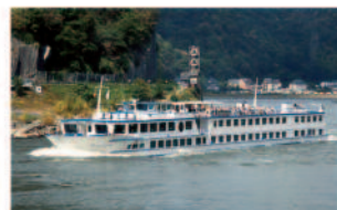
m.p.s. Poseidon 100 Passagiere, 49 Kabinen