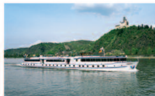
m.p.s. Azolla 90 Passagiere, 45 Kabinen