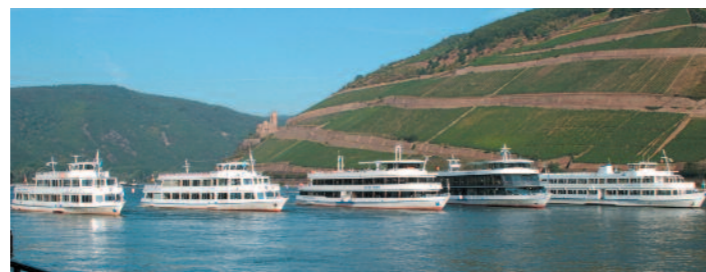
Fünf unterschiedlich ausgestattete Schiffe – buchbar für jeden Anlass.

von Rüdesheim bis Sankt Goarshausen ins Weltkulturerbe Mittelrheintal, vorbei an idyllischen Weinorten, steilen Weinbergen und vielen Burgen. Ebenfalls zum Linienverkehr gehören die Burgenfahrten und die romantischen Abendfahrten, ergänzt um Events wie Silvesterfahrt, „Literaturschiff“, Riverboat-Shuffles, Tanzfahrten zu verschiedenen Weinfesten und der Sommernachtsparty mit Feuerwerk. In der laufenden Saison gibt es für Busgruppen 30% Ermäßigung und