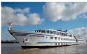
m.p.s. Statendam 186 Passagiere, 98 Kabinen