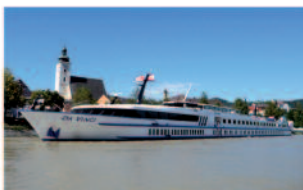
m.p.s. Da Vinci 110 Passagiere, 57 Kabinen