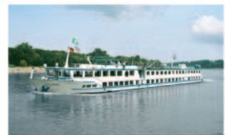
m.p.s. Calypso 92 Passagiere, 46 Kabinen

Auskunft: sales@feenstrarijnlijn.nl oder rufen Sie an: +31 26 445 69 83