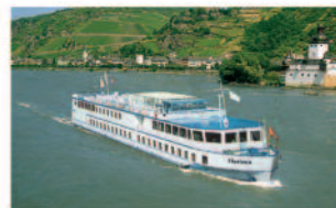
m.p.s. Horizon 98 Passagiere, 49 Kabinen