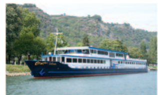
m.p.s. Salvinia 124 Passagiere, 64 Kabinen