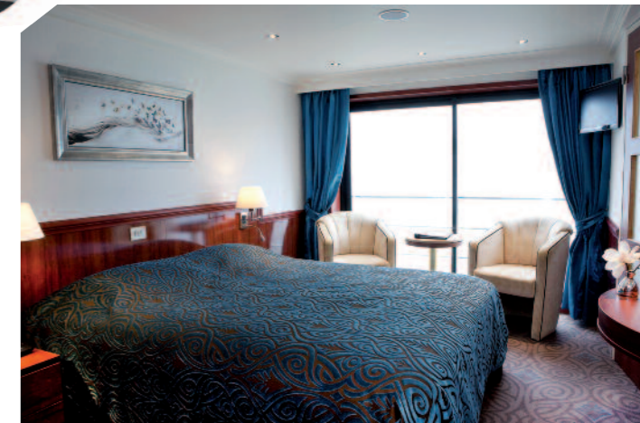
Die Ausstattung der Kabinen überzeugt mit luxuriösem Ambiente.

Feenstra Rijn Lijn Tel.: 0031-264456983 Sales@feenstrarijnljn.nl www.feenstrarijnljn.nl