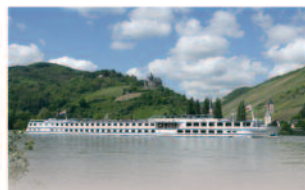
m.p.s. Rembrandt van Rijn 127 Passagiere, 63 Kabinen