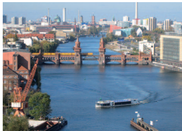
Die etwas andere Stadtrundfahrt – Berlins Wasseransichten.

Denkt man an Berlin, dann denkt man zunächst an den Wannensee oder auch an den Müggelsee – aber mitten durch die Stadt führen die Spree und der Landwehrkanal. Diese Wasserwege umschließen das Herz der Innenstadt wie ein Kreis. Mit keiner anderen Metropole Europas vergleichbar, reihen sich unzählige Sehenswürdigkeiten an den Ufern aneinander. Die Flotte der Reederei Riedel (bestehend aus zehn Fahrgastschiffen) startet täglich zu vielen Linienfahrten, vorwiegend im innerstädti-