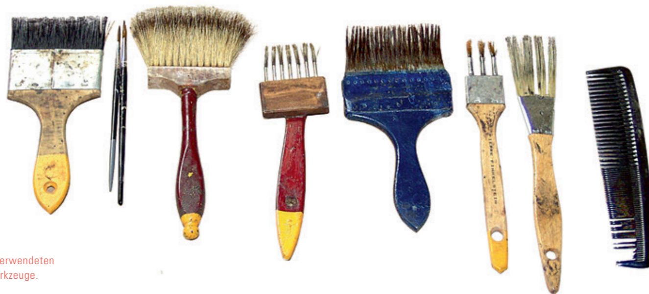
Auswahl der verwendeten Pinsel und Werkzeuge.

oft dominierende Bodenfarbigkeit. Gilt es doch einerseits, die gewünschte feine Trennung von Bodenflächen und Wandtäfer zu erreichen und andererseits trotzdem einen verbindenden Raumeindruck zu schaffen. Aus diesem Grund werden die Schlusslasuren der Holzimitationsmalerei oft erst nach dem Einbau und der ersten Oberflächenbehandlung der Holzböden aufgetragen. Damit können farbliche Feinkorrekturen noch vorgenommen und die gewünschte Raumwirkung gesamtheitlich erzielt werden.