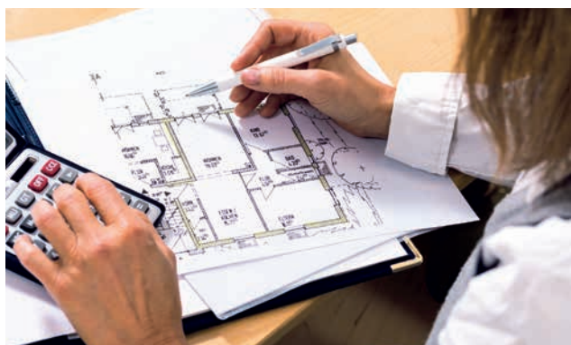
3 | Schon kleine Rechenfehler bei der Mengenermittlung können große Differenzen bewirken.

Die Anteile für WuG + AGK sind jedoch zu berücksichtigen.