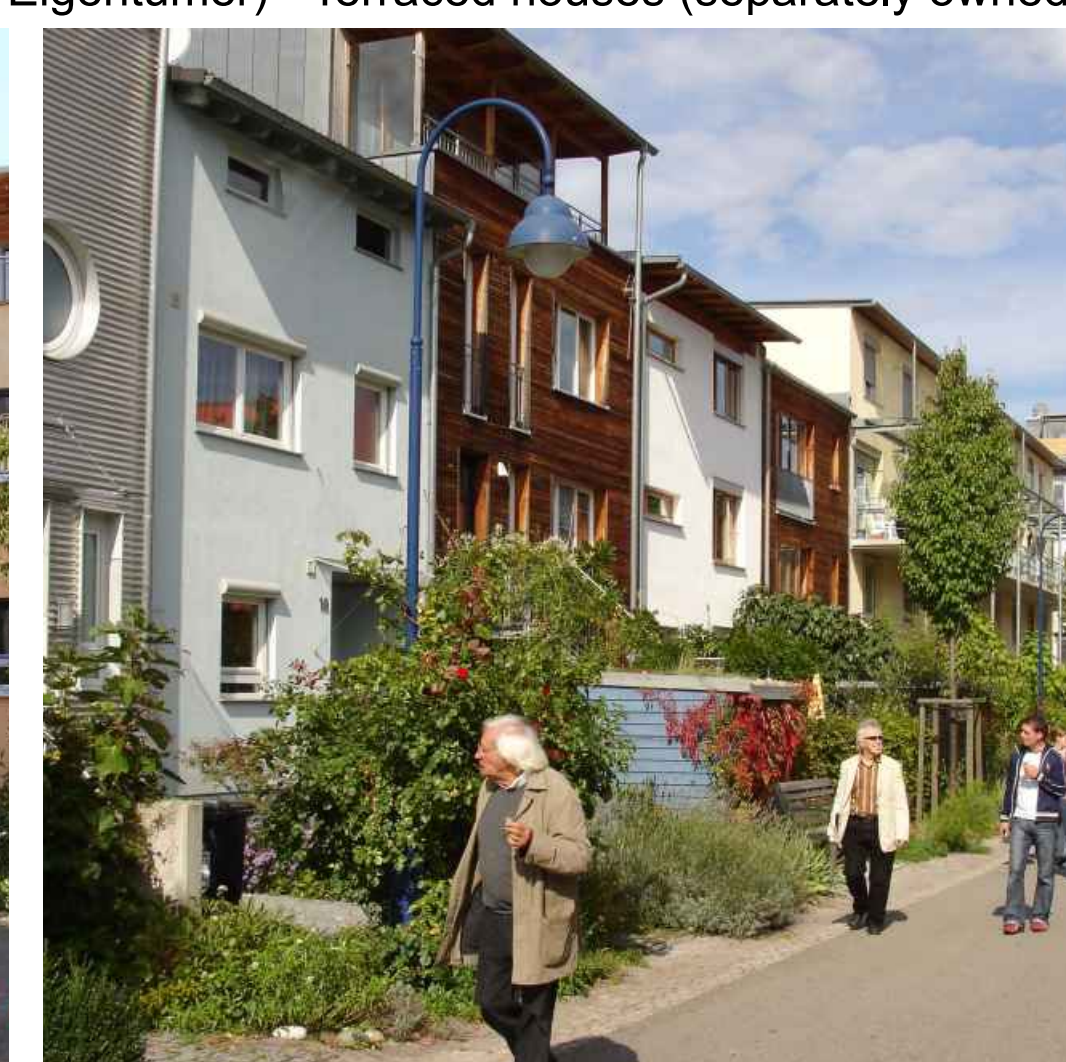
Reihenhäuser - Terraced houses