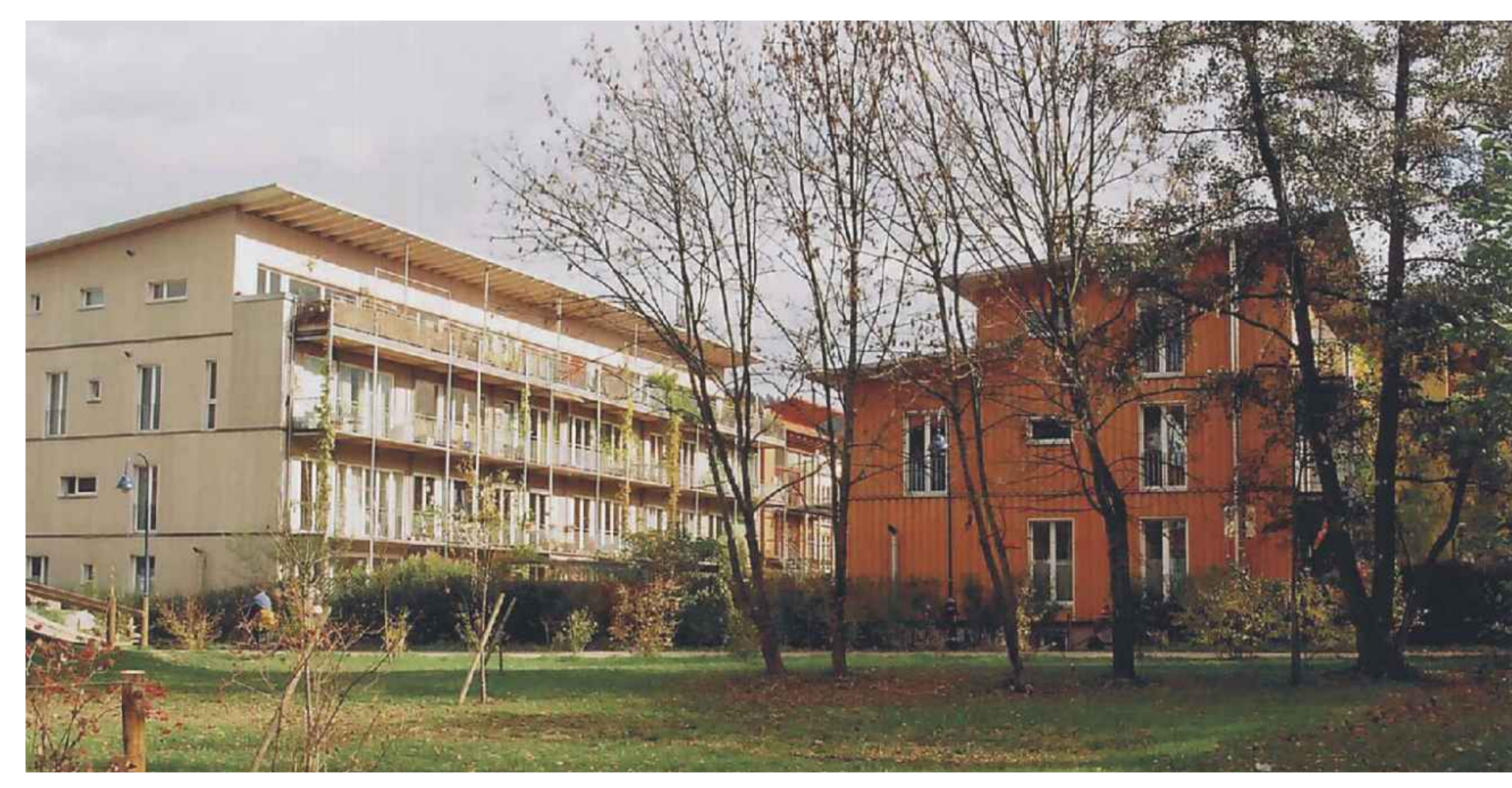
Mehr- u. Einfamilienhäuser Baugruppe - Multiple-family houses and terraced houses with several-building owners

To allow for individual designs and to prevent the development of a monostructural residential area, building plots were predominantly distributed to private building-owners (approx. 70%). The houses built by private owners can be divided into single building projects (on parcels with a width between 6 m and 9 m) and building projects of groups of building-owners who cooperated in the development of the building from the start. Normally these are four-storey multiple-family houses, which consist of two accommodation units built on top of each other with each unit taking up two storeys (maisonette). The upper unit is reached via an access balcony. The objects of property developers with partly different ways of access (e.g. stairwells with access to several different accommodation units via each landing) can be divided into apartment buildings, condominiums, and buildings with a mix of both condos and rented apartments. The latter case applies to some of the cooperative building projects. So far, plots in the sectors dedicated to five-storey buildings with a building height of up to 15 m have only been allotted to larger groups of building-owners and property developers without exception (as is currently the case in sector 3).