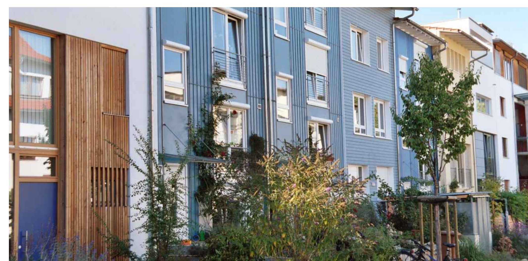
Rahel-Varnhagen-Str. / Reihenhäuser (einzelne Eigentümer) - Terraced houses (separately owned)