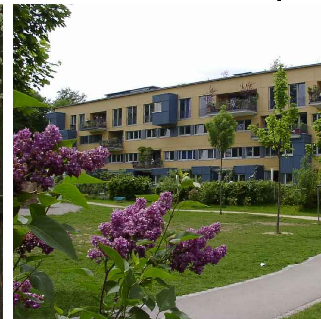
Mehrfamilienhaus Baugruppe-Multiple-family house, several building-owners