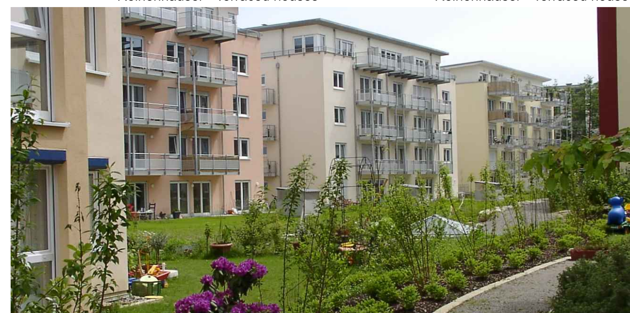
Louise-Otto-Peters-Straße / Bauträgerobjekte - Developed properties