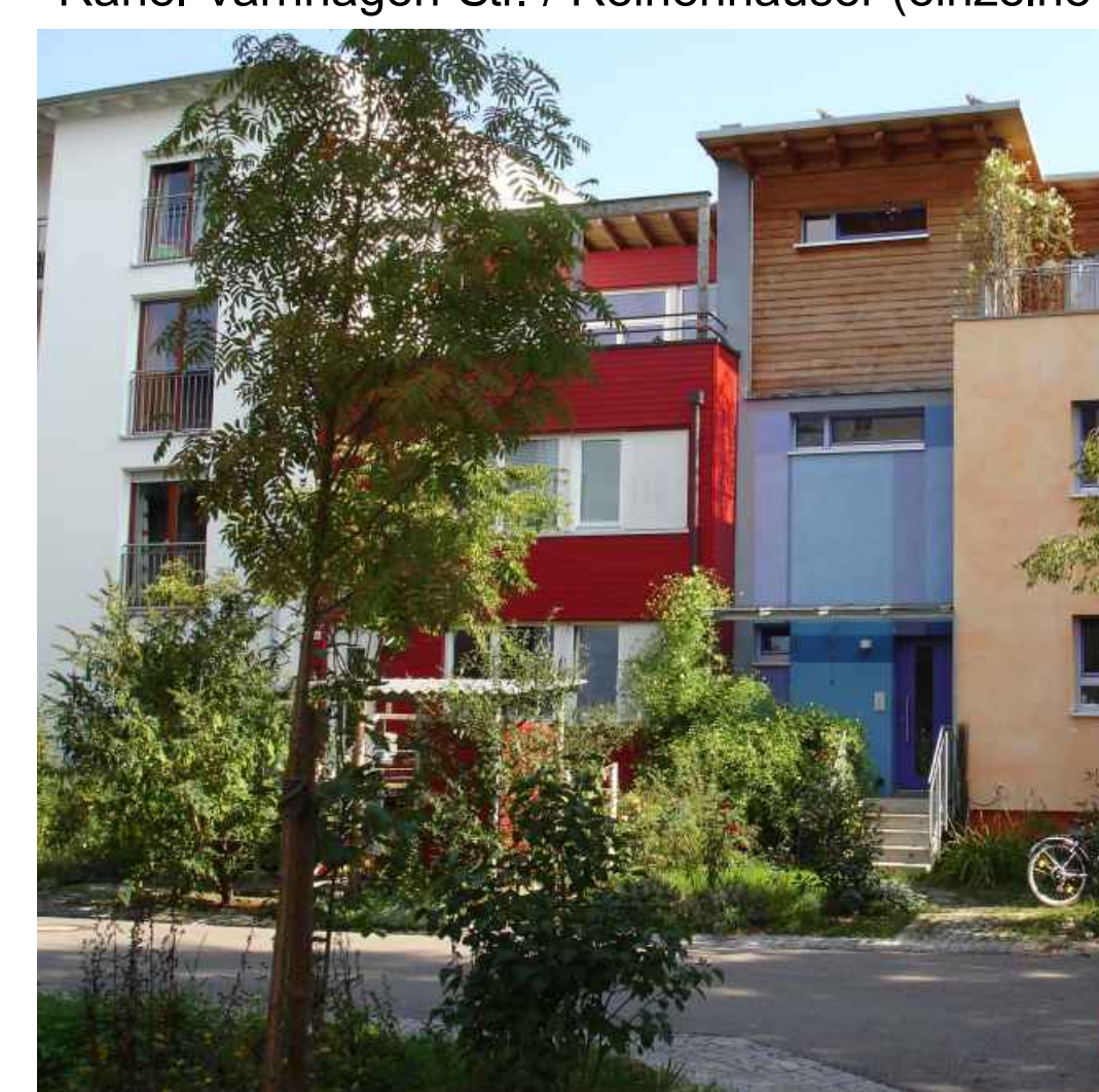
Reihenhäuser - Terraced houses