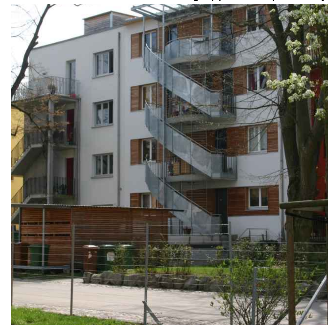
Mehrfamilienhaus Baugruppe-Multiple-family house, several building-owners