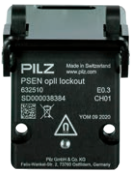
PSENopt II lockout