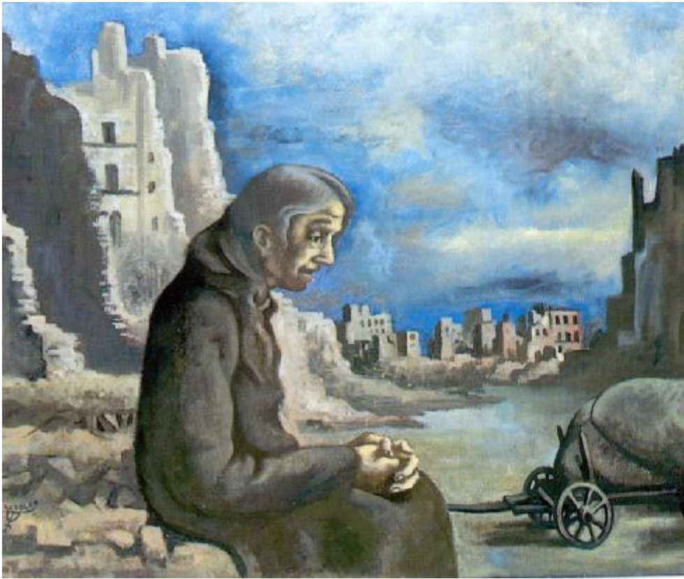
Der Flüchtling, (Gemälde von August W. Dressler aus dem Jahr 1946)