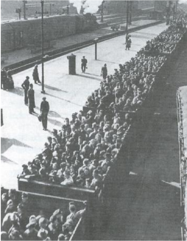
Transport vertriebener Deutscher aus der Tschechoslowakei.

Welchen Eindruck hinterlässt der Abtransport der Deutschen?