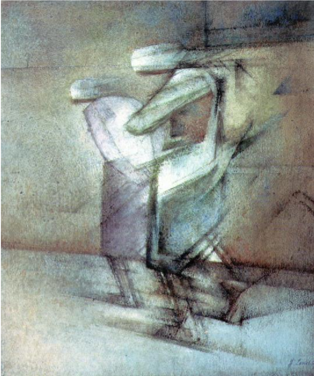
(Museum Ostdeutsche Galerie, Regensburg)