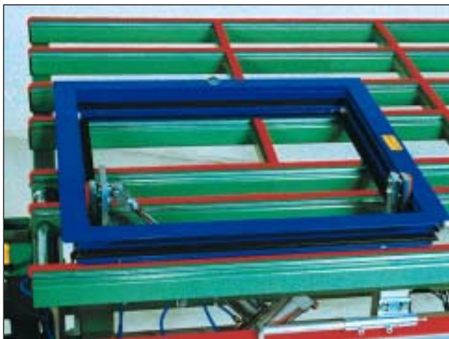
Abtaster für die Glasleistenlänge am Flügel angelegt.