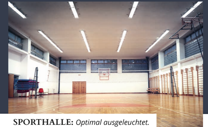
SPORTHALLE: Optimal ausgeleuchtet.

Bei unseren Projekten ist LED-Technik der bevorzugte Lösungsweg, denn ihr Einsatz reduziert Stromverbrauch sowie laufende Kosten nachhaltig und leistet einen wertvollen Beitrag zum Klimaschutz.