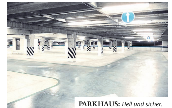
PARKHAUS: Hell und sicher.