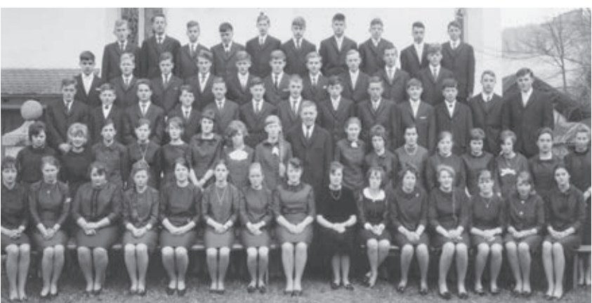
Konfirmation Palmsonntag 1966