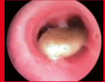
Stein in Trachea

Sollte der Zustand Ihres Kindes stabil sein, dann wird zunächst eine körperliche Untersuchung durchgeführt und eine Röntgenaufnahme angefertigt. Wie schnell der Fremdkörper geborgen werden muss, hängt in erster Linie vom Zustand bzw. dem Beschwerdebild Ihres Kindes ab.