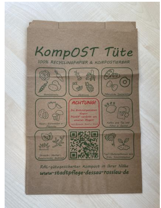
Bild: KompOST Tüte mit Firmeninternetseite und QR-Code zur Weiterleitung auf die Sortiervorgaben.