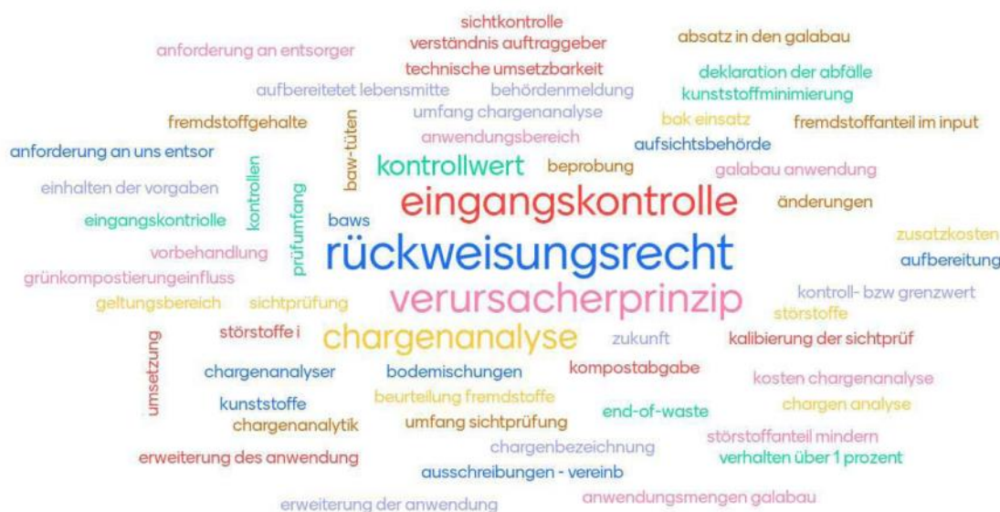
Bild: Wortwolke zur Fragestellung „Was beschäftigt Sie bei der Novelle der BioAbfV?“ mit Rückmeldungen von 73 Teilnehmern. Wörter, die mehrfach genannt wurden, erscheinen größer.

technischer und vertraglicher Maßnahmen (neuer §2a BioAbfV) ein Zeitraum von drei Jahren eingeräumt worden. Die BioAbfV wird somit auch künftig die Branche intensiv beschäftigen, was seitens der BGK in Praxisseminaren, FAQ's etc. weiterhin begleitet wird. (LN)