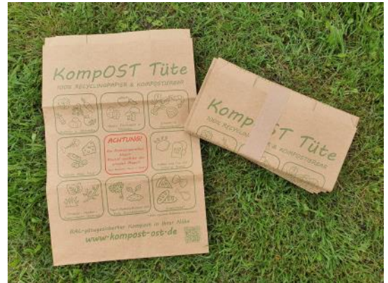
Bild: KompOST Tüte im Standarddesign.

Die KompOST Tüten werden mit einer ebenfalls aus Recyclingpapier bestehenden Banderole als 10er Pack gebündelt und können zu einem Verkaufspreis von 1,50 € je Set angeboten werden. Bei Interesse und Nachfragen wenden Sie sich bitte an die Geschäftsstelle der Gütegemeinschaft Kompost Ost e.V: Tel.: 035327 / 599910, E-Mail: info@kompost-ost.de , www.kompost-ost.de (KW, BAL)