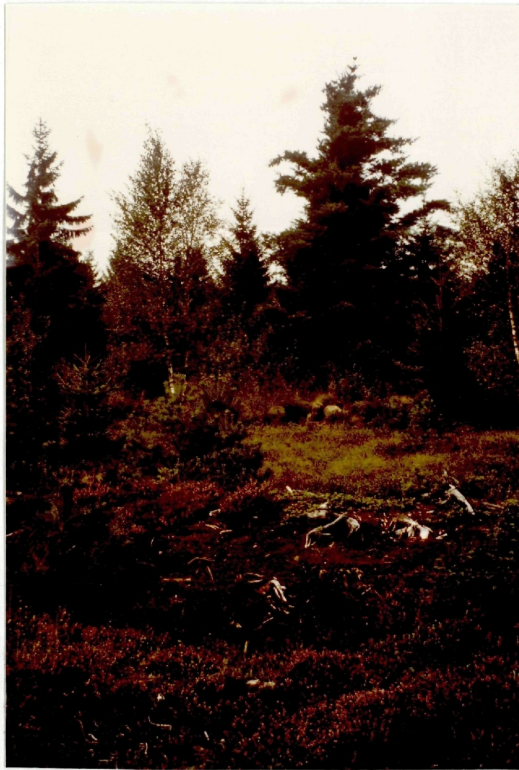
Foto Nr.6 Hochmoor mit Entwässerungsgraben