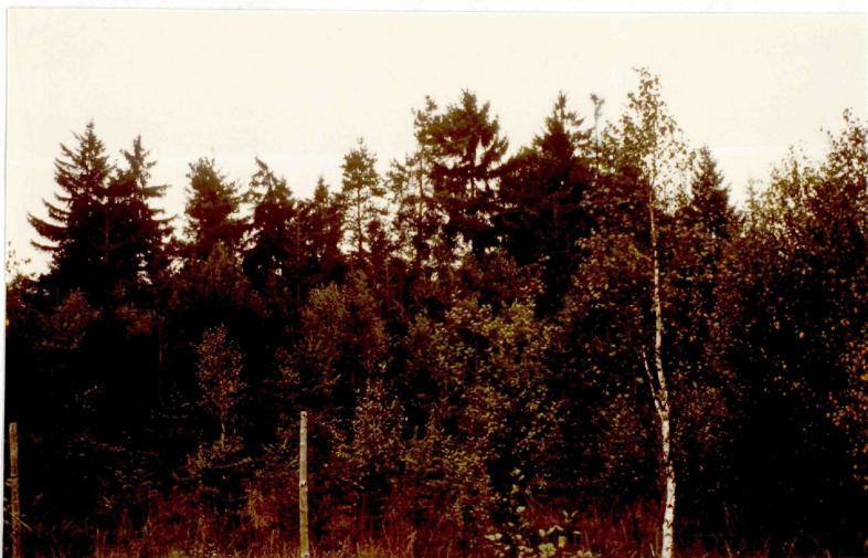
Foto Nr.11 Östlicher Umzäunungsrand mit dahinter verlaufender Hochspannungsleitung