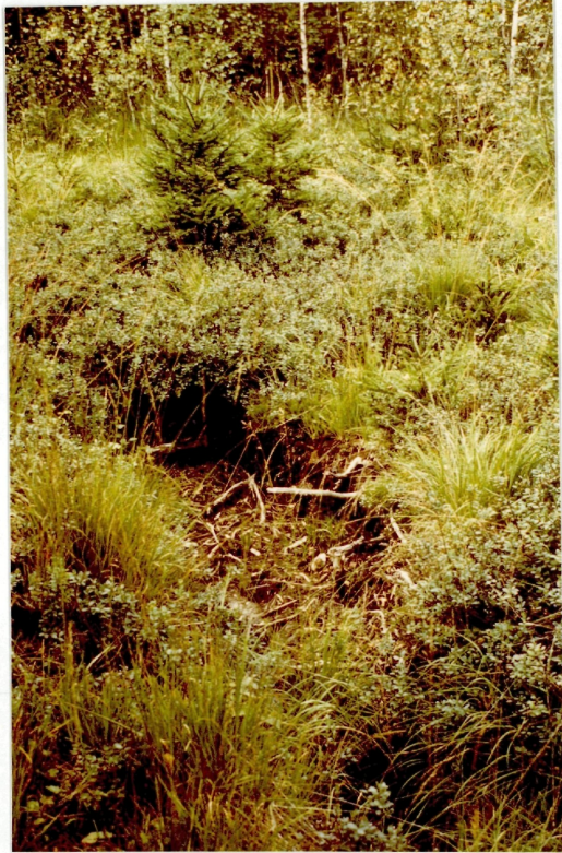
Foto Nr.7 Hochmoor - Randbereich, teilweise sind die Gräben wieder zugewachsen