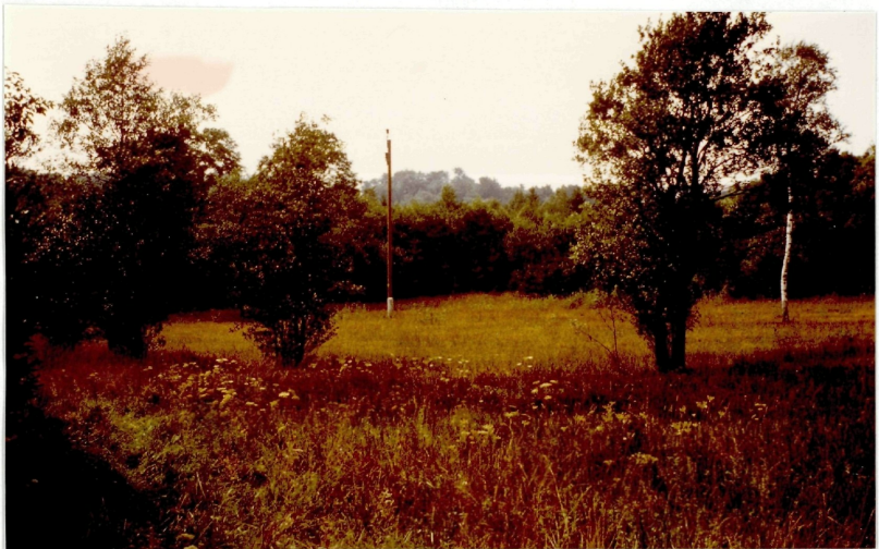
Foto Nr.2 Südwestlicher Teil des Molinietums mit querverlaufender Hochspannungsleitung