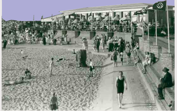
Weserbad 1935. Ab dem 25. Juli 1935 verbietet ein Schild am Eingang des Bades Jüd:innen den Zutritt.

Für den Tag der Stadtgeschichte forschen seit 2015 jedes Jahr abwechselnd etwa 150 Schüler:innen der Schulzentren Carl von Ossietzky und Geschwister Scholl sowie des Lloyd Gymnasiums zu 50 Orten und Biografien der Stadt während der Zeit des Nationalsozialismus (NS) und vermitteln dies an 1500 Schüler:innen und die interessierte Öffentlichkeit.