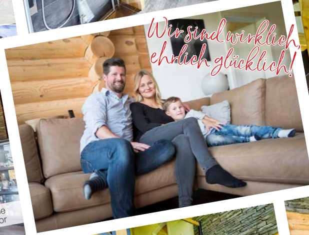
Wir sind wirklich ehrlich glücklich!