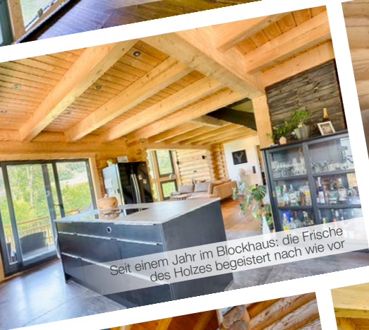
Seit einem Jahr im Blockhaus: die Frische des Holzes begeistert nach wie vor