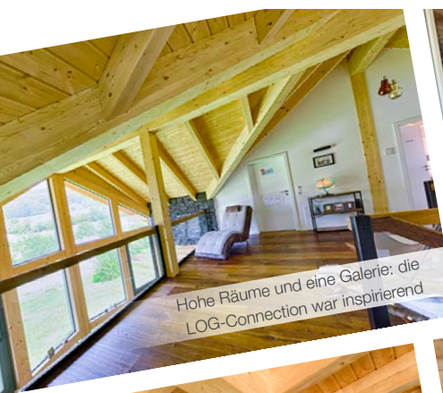
Hohe Räume und eine Galerie: die LOG-Connection war inspirierend