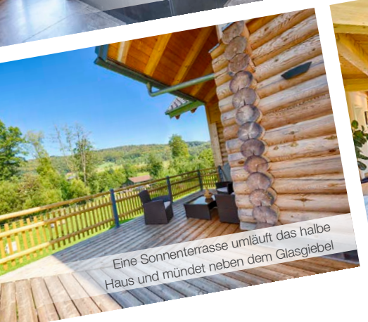
Eine Sonnenterrasse umläuft das halbe Haus und mündet neben dem Glasgiebel