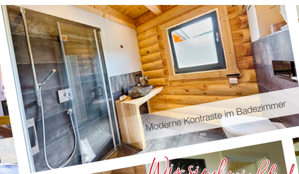
Moderne Kontraste im Badezimmer