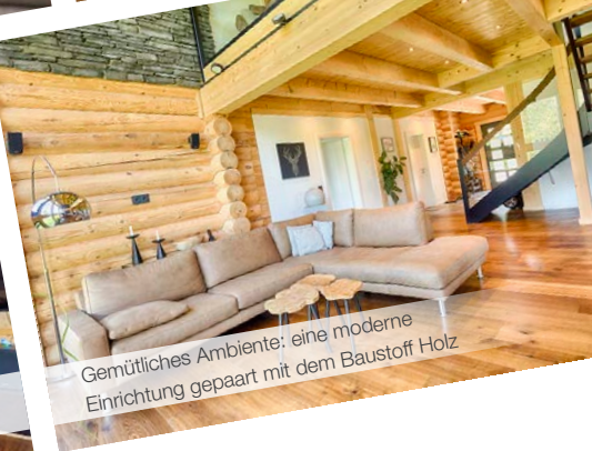
Gemütliches Ambiente: eine moderne Einrichtung gepaart mit dem Baustoff Holz

Das stolze Gefühl, dass unseren Bauherren aus allen Poren zu sprießen scheint, springt auch auf uns von LéonWood® über. Wir freuen uns sehr, dass wir so enthusiastische Menschen zu unseren Bauherren zählen dürfen.