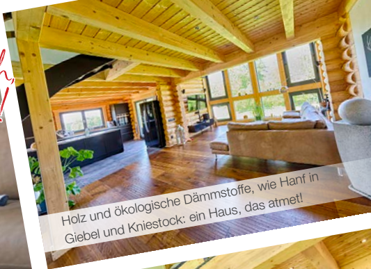
Holz und ökologische Dämmstoffe, wie Hanf in Giebel und Kniestock: ein Haus, das atmet!