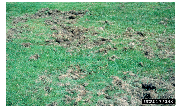
4. Schaden an einer Wiese durch die Larven des Japankäfers

Zierpflanzen: Calluna vulgaris (Heide), Dahlia sp., Aster sp., Zinnia sp. u.a. sowie die Ziergehölze Thuja sp., Syringa sp. (Flieder), Virburnum sp. (Schneeball) u.a.