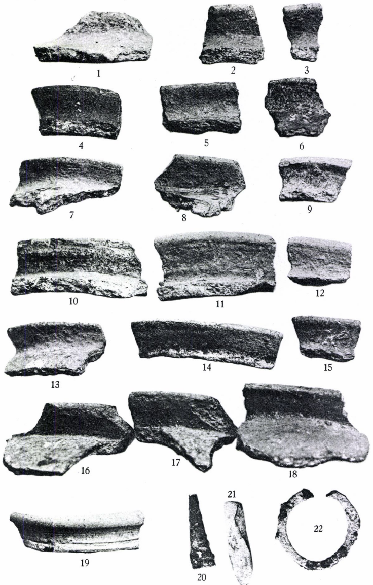
Fundstücke von der Oldenburg