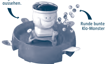
Runde bunte Klo-Monster

Euer Spiel muss jetzt folgendermaßen aussehen.