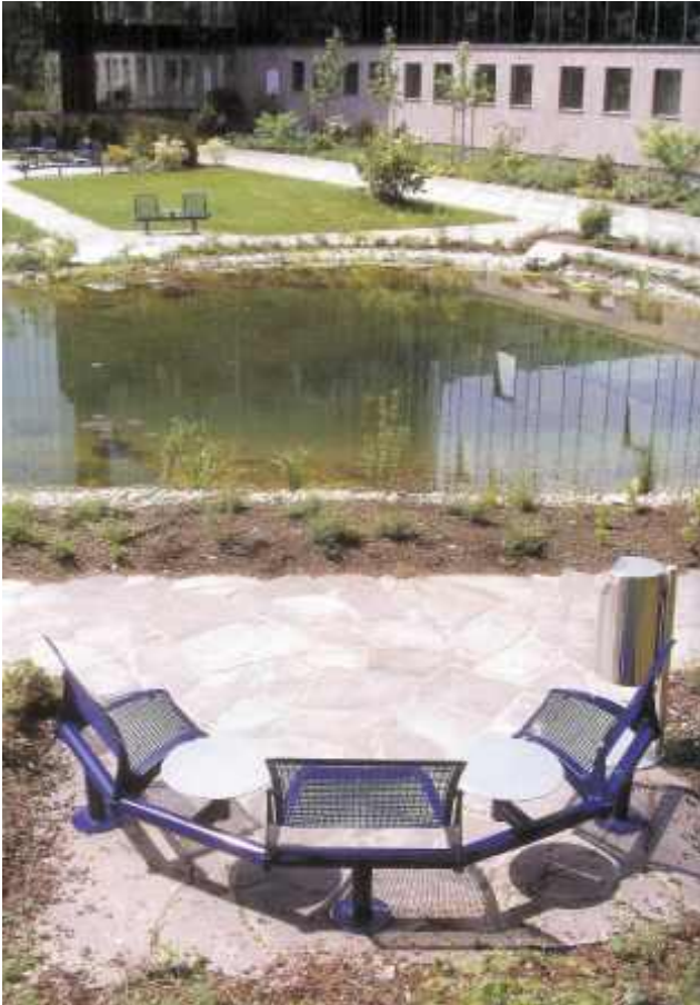
(Design 5000 Innenkreis mit Taschenablage)

Seit 1982 hat METDRA sein Außenmöbelprogramm kontinuierlich erweitert und optimiert. Dabei hat sich die heute zu den führenden Unternehmen in der Branche zählende Metall- und Drahtwarenfabrik vor allem wegen der ausgezeichneten Qualität und Passgenauigkeit ihrer Produkte einen guten Ruf erworben.