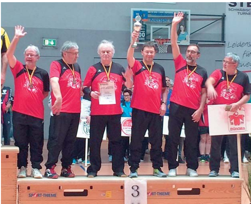
Siegerehrung bei den DM M60: 3. Platz und Bronzemedaille für die Mannschaft des MTV