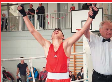
Oberbayerische Meisterschaften im Amateurboxen beim MTV