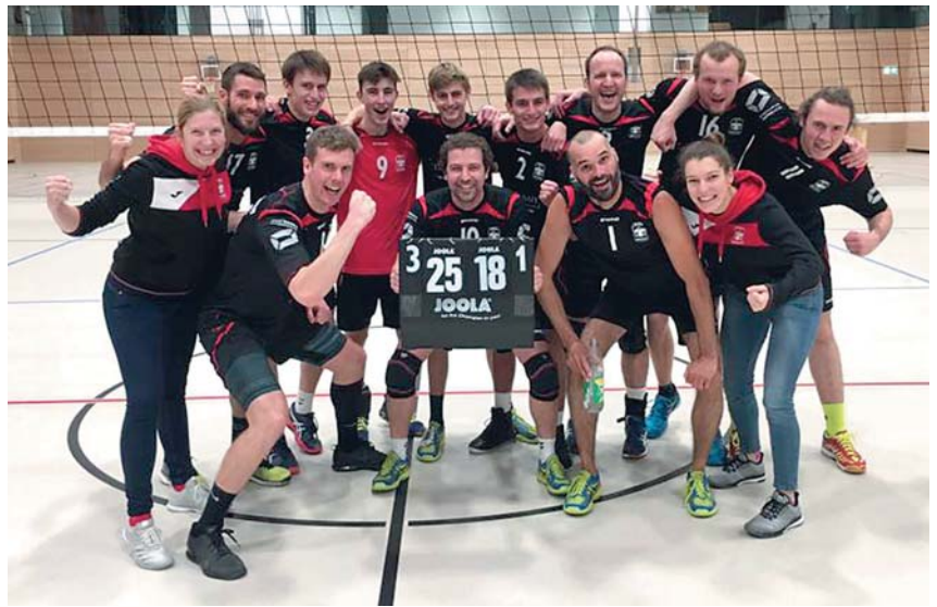
Herren 3: Freude über den Aufstieg