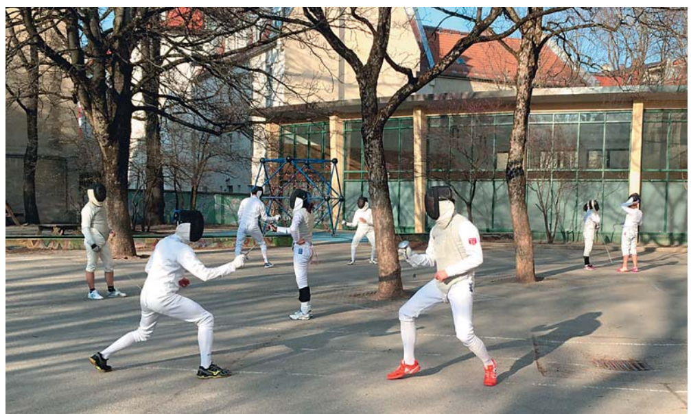
Samstagstraining: Fechtübungen in den ersten Frühlingsstrahlen

Beim allabendlichen Aufbau der Technik haben wir schon große Übung bekommen, aber auch das kürzt die Trainingszeit, und wir vermissen unsere Meldeanlage, sowie die fest installierten Bahnen des Fechtsaals, die auch sicherer sind für des Fechters Gelenke. Das sind jedoch Luxusprobleme.