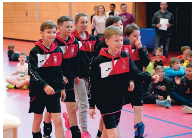
U13 wurde Münchner Meister