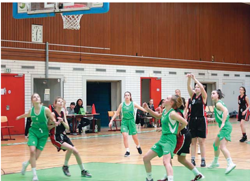
Die U16w in den Playoffs – volle Attacke am Korb