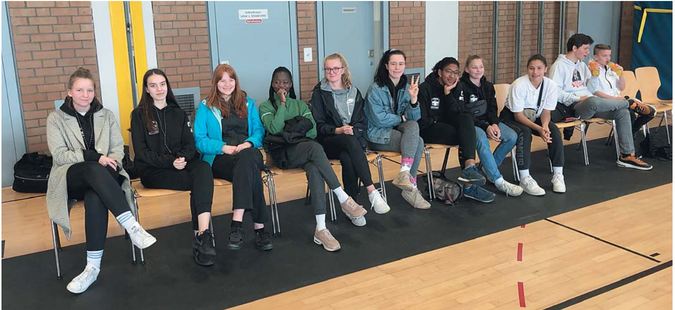
Die U18w – beim Endspiel um die Bayerische nur in der Zuschauerrolle

Riesenchance auf den Meistertitel leichtfertig vergeben!“ Denn der TV Schwabach (Sieger Gruppe A) gewann das Endspiel gegen Jahn München (der OBB-Zweite hatte in der Gruppe B die deutlich schwächeren Gegner) sicher mit 47:41.