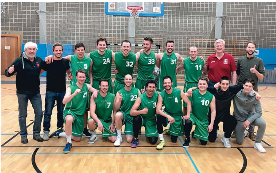
Das MTV-Herrenteam mit Headcoach Michael hat die Meisterschaft schon frühzeitig perfekt gemacht

Die besten sechs Teams aus ganz Bayern hatten sich für dieses Finale qualifiziert: Gastgeber Nördlingen (Schwaben), TV Schwabach (Mittelfranken), SC Kemmern (Oberfranken), Baskets Neumarkt (Oberpfalz), Jahn München (2. BOL Oberbayern), MTV München (1. BOL Oberbayern).