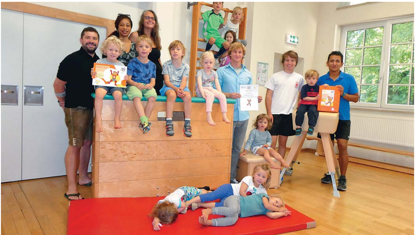
Übergabe BAERchen Paket mit den KiSS Trainern und Regenwurm e.V

Wir freuen uns, im Jahr 2019 mit weiteren KiSS Kooperationen das BAERchen Projekt durchzuführen.