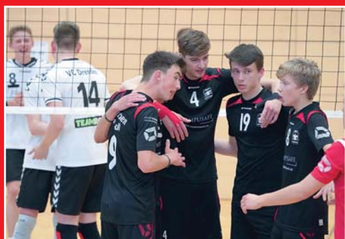
Volleyball U18m unter den Top 10 in Deutschland

Basketball Herren 1 ungeschlagener Meister