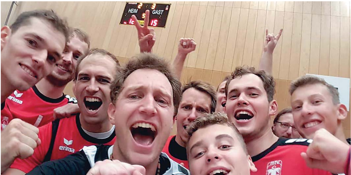
Herren 1: Freude über den Klassenerhalt