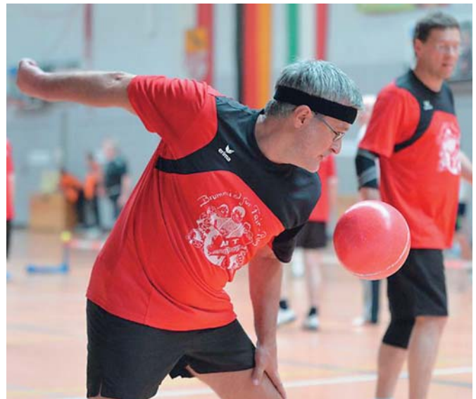
Hohe Konzentration bei der Angabe

DM-Ergebnisse MTV München: - Meinerzhagen 34:35, - Kutenholz 42:24, - Burgdorf 28:37, - Hannover-Ricklingen (ZR) 31:27; - Burgdorf (HF) 23:33, - Essen-Haarzopf (Sp. um Pl. 3) 35:32. Tabelle: 1. und Deutscher Meister TSV Burgdorf; 2. TSV Ludwigshafen, 3. MTV München, 4. TB Essen-Haarzopf, 5. TuS Meinerzhagen, 6. SF Ricklingen; 7. Idarer TV, 8. VfL Kutenholz.