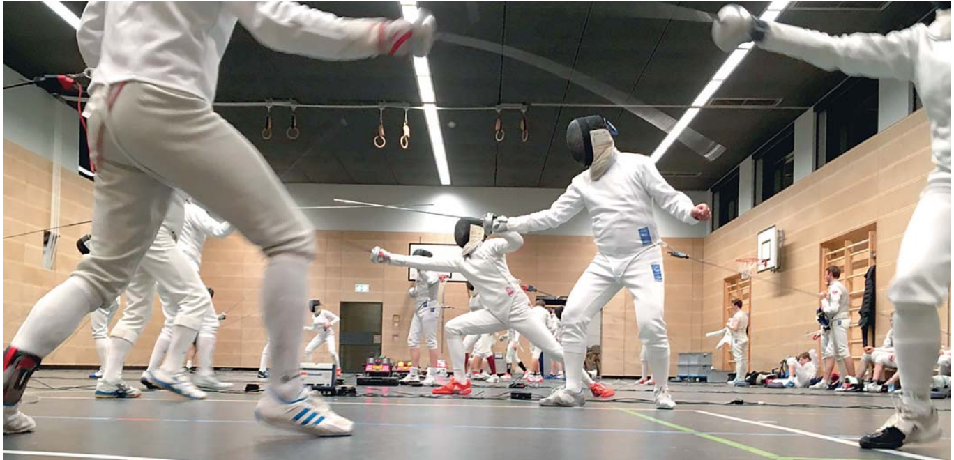
Das Quartier in der Meindlstraße