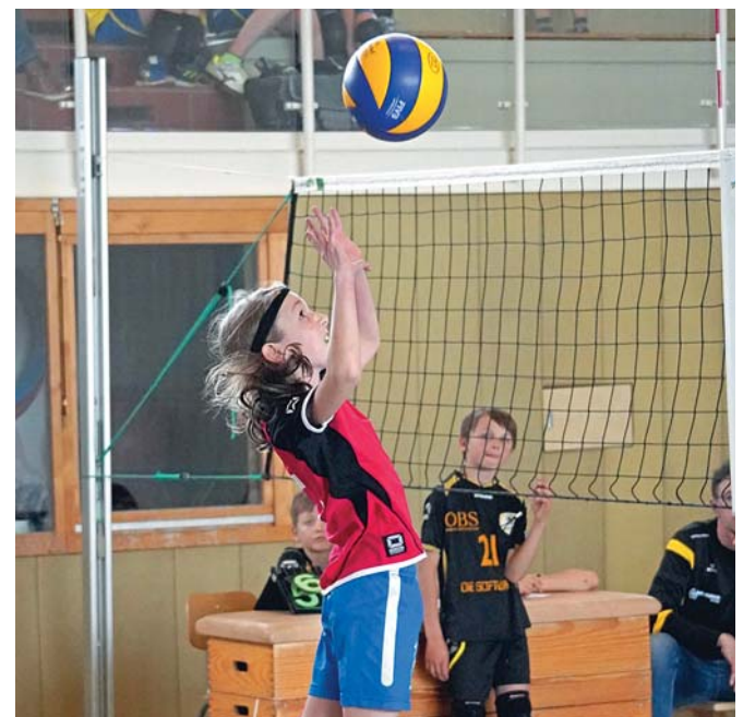
Spislszene aus einem Spiel der U12