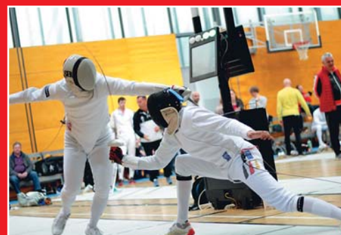
MTV Degenfechter bei der DM in Leipzig