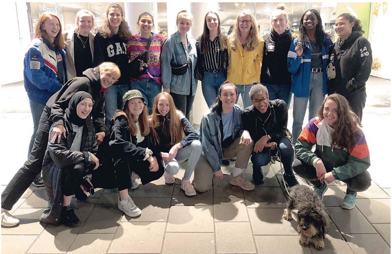
Abendspaziergang in Wien mit den „großen“ MTV-Mädels – die U13w lag schon in den Betten

Für die neue Saison in der Bayernliga werden noch dringend einige erfahrene, gestandene Spielerinnen gesucht!! Kommt einfach mal im Training vorbei!