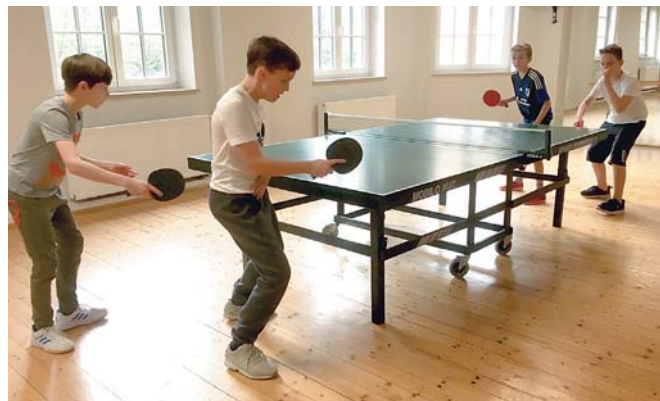
Kinder- und Jugendtraining im Gesundheitsraum

www.mtv-muenchen.de/Sportangebot/Tischtennis/Aktuelles/