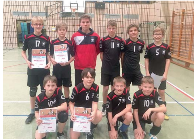
Die Spieler der U14

Wer jetzt Lust auf Volleyball bekommen hat, setzt sich einfach mit uns in Verbindung. Die Jahrgänge 2010 /11 sind die nächsten Jungs in der Halle. Auch Quereinsteiger von anderen Sportarten sind in allen Jahrgangstufen herzlich willkommen.