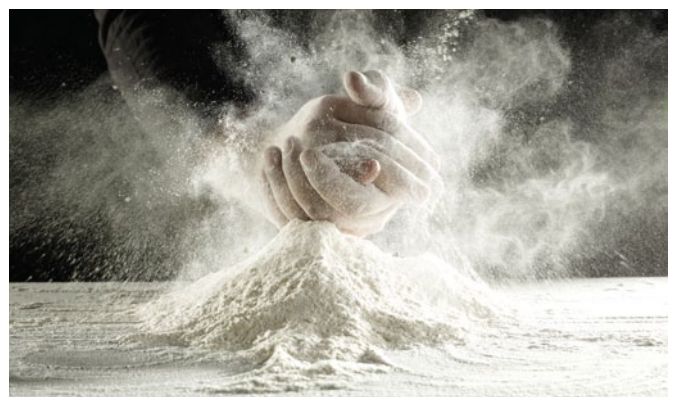
Abb. 2-4: Neben dem Rauchen als Hauptursache können auch Schadstoffe am Arbeitsplatz (z. B. Bäckerei, Bergbau, Landwirtschaft) sowie Umweltverschmutzung eine COPD verursachen.