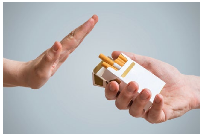
Abb. 6: Bei einer manifesten COPD gilt: Weg mit dem Glimmstengel!

Eine weitere präventive Maßnahme ist das Vermeiden von Atemwegsinfektionen durch Schutzimpfungen gegen Influenza und Pneumokokken.