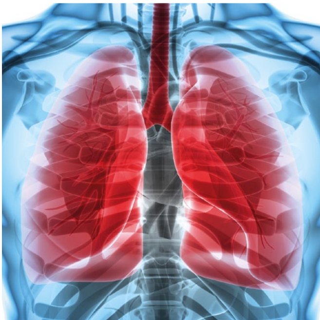
Abb. 1: Lunge 3D-Model

COPD ist ein Sammelbegriff für chronische Lungenerkrankungen mit progredientem Verlauf auf dem Boden einer chronischen Bronchitis und/oder eines Lungenemphysems. Die Krankheit ist nicht reversibel; auch nach Gabe von Bronchodilatoren und/oder Kortikosteroiden erfolgt bei COPD keine vollständig reversible Atemwegsobstruktion.