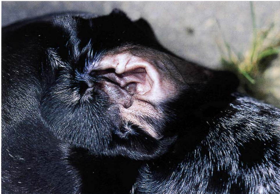
Nicht Immer ist eine Ohrenentzündung von außen zu erkennen.

Ohrenentzündungen stellen sich recht deutlich durch vermehrtes Schütteln des Kopfes, Kratzen am Ohr, Rutschen mit dem Ohr am Boden sowie durch eine schiefe Haltung des Kopfes dar.