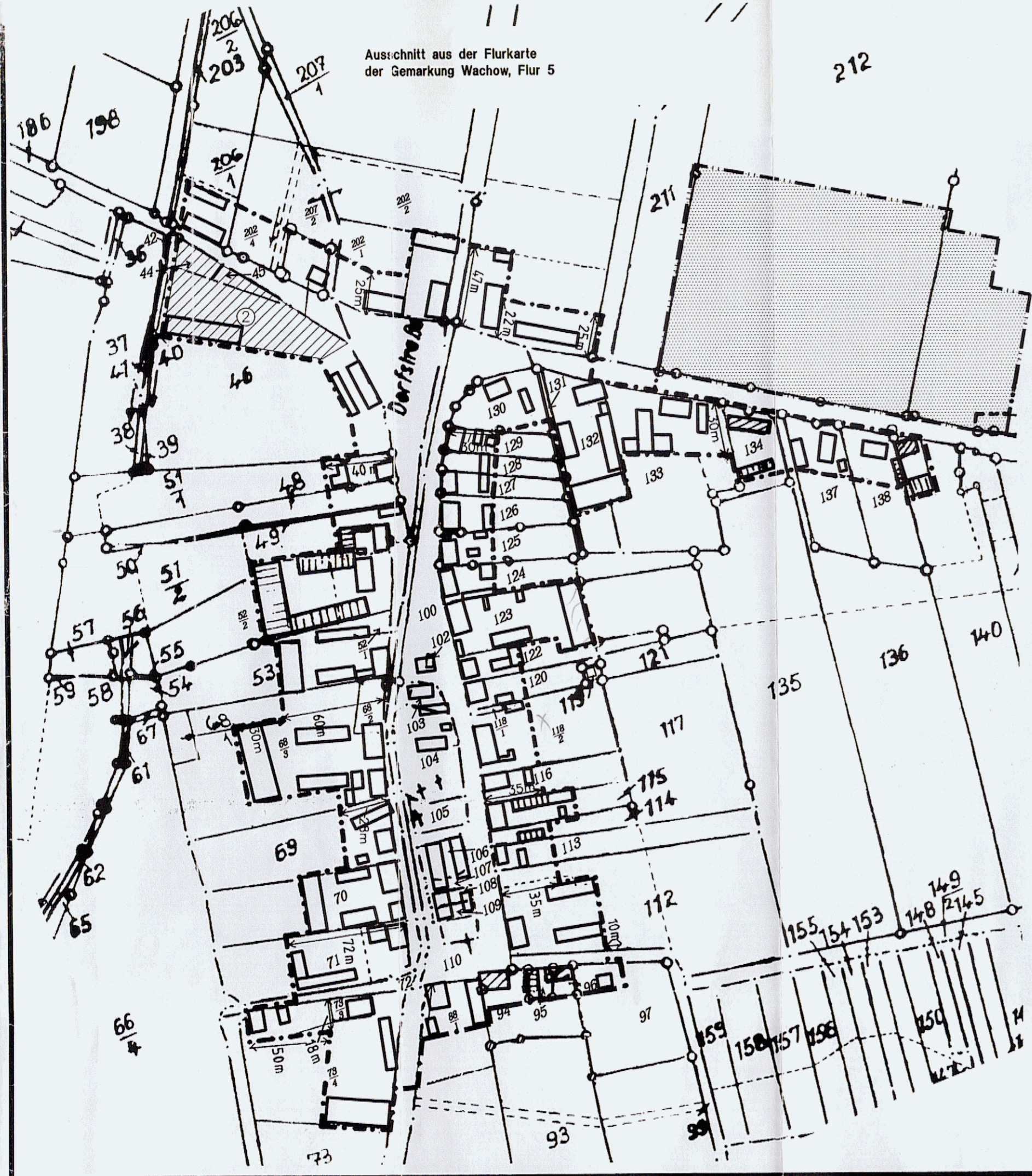
Ausschnitt aus der Flurkarte der Gemarkung Wachow, Flur 5