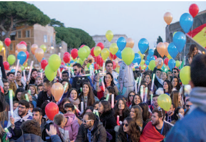
Erasmus-Studierende aus verschiedenen Ländern bei einer Kulturveranstaltung in Rom