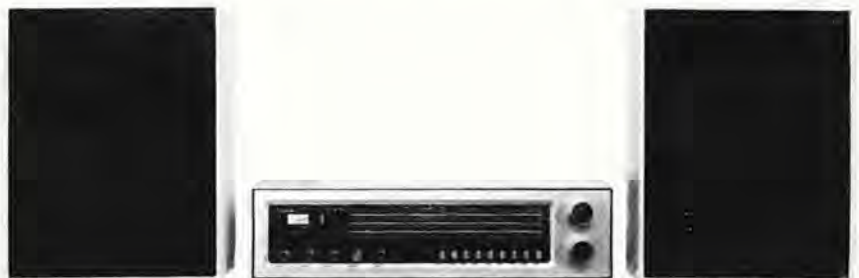
Die volltransistorisierten Heim-Hörrundfunkempfänger „adagio“ und „arioso“ der Rema KG Stollberg wurden nach einer einheitlichen Konzeption entwickelt. Sie repräsentieren ein hohes technisches Niveau, einen hohen Bedienungskomfort und einen hohen Gebrauchswert.

Mit der Entwicklung einer Reihe von UKW- Eingangsteilen mit abgestuften Qualitäts-