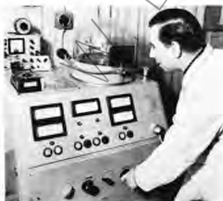
Arbeitsplatz für die Bearbeitung verschiedener Teile im Hochvakuum.