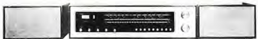
Die volltransistorisierten Heim-Hörrundfunkempfänger „adagio“ und „arioso“ der Rema KG Stollberg wurden nach einer einheitlichen Konzeption entwickelt. Sie repräsentieren ein hohes technisches Niveau, einen hohen Bedienungskomfort und einen hohen Gebrauchswert.

Weitere Beispiele der Anwendung von Entwicklungsergebnissen wurden mit der Ausarbeitung der schaltungstechnischen Konzeption eines Reiseempfängers mit diodenabgestimmtem UKW-Eingangsteil und Stationswahltaasten sowie der Entwicklung eines Reiseempfängers in Kombination mit einem ebenfalls im ZRF entwickelten Kassettenbandgerät gegeben. Am Modell eines mit automatischen Senderschlaf für den UKW-Bereich ausgerüsteten Autosupers wird sowohl der Einsatz des diodenabgestimmten UKW-Eingangsteils als auch eine im ZRF entwickelte Schaltung für den elektronischen Teil des Suchlaufs demonstriert. Nahezu alle zur Anwendung der Entwicklungsergebnisse für neue Erzeugnisse durchgeführten Arbeiten erfolgten als Vorarbeit für Entwicklungsvorhaben der Produktionsbetriebe auf Vertragsbasis. Das ZRF wurde damit der Zielstellung gerecht, den wissenschaftlich-technischen Vorlauf für den Industriezweig über die Lösung von Grundsatzproblemen und vorbereitende Entwicklungen für die Schaffung neuer Erzeugnisse zu sichern. Die Durchsetzung moderner technischer Konzeptionen auf dem Sektor Hörrundfunkempfängertechnik war in den zehn Jahren des Bestehens des ZRF eine der Aufgaben, die mit gutem Resultat gelöst wurde. Die Ergebnisse der Arbeiten sind mitbestimmend für den heutigen Stand der Technik bei vielen Erzeugnissen des Industriezweiges Rundfunk und Fernsehen der DDR.