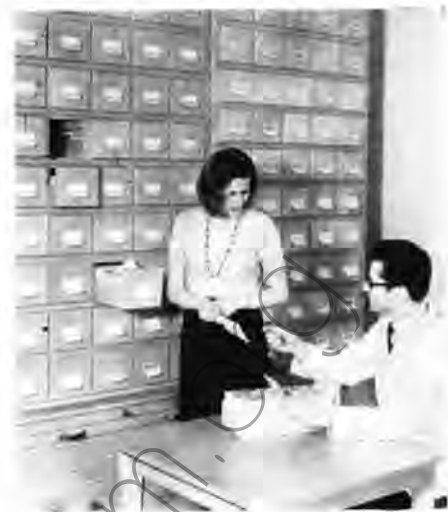
Information und Dokumentation auf dem Gebiet der Fernsehempfangstechnik, der Phontechnik sowie der angrenzenden Fachgebiete unterstützen die Forschung und Entwicklung.

Zur vollständigen Darstellung der Erfindertätigkeit müßten auch die Erfindungen genannt werden, für die noch kein oder aus Prioritätsgründen kein Schutzrecht erworben werden konnte, was aber hier im schutzrechtspolitischen Rahmen unterbleiben mußte. Dafür sei aber erwähnt, daß für die genannten Erfindungen mit nur wenigen Ausnahmen außer der Patentierung in der DDR im Durchschnitt etwa zwei Schutzrechtsanmeldungen im Ausland erfolgen konnten und daß das Fachgebiet Wissenschaftlich-technischer Rechtsschutz in den letzten Jahren bis zu 10 Anmeldungen im Jahr für andere Betriebe neben seinen anderen Aufgaben bearbeitet. Für das Jahr 1970 ist nach gegenwärtiger Einschätzung mit dem Entstehen von insgesamt zwölf schutzfähigen Erfindungen im ZRF zu rechnen.