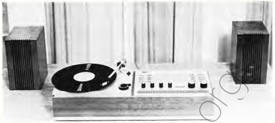
Labormodell einer volltransistorisierten Phono-Rundfunkempfänger-Kombination, die mit einheitlichen Funktionsgruppen aufgebaut wurde.

Die Ergebnisse aus den Arbeiten zur Entwicklung transistorisierter Zwischenfrequenzverstärker haben gezeigt, daß es möglich ist, auch hohe Qualitätsansprüche zu erfüllen. Der ZF-Verstärker 1 ist unter Verwendung von Standardfiltern aufgebaut und besonders für den Einsatz in HF-Stereo-Heimeräten der oberen Preisklasse bestimmt. Im FM-Zweig ist dieser Verstärker 4stufig und im AM-Zweig 2stufig. Eine Variante dieses Zwischenfrequenzverstärkers ist der ZF-Verstärker 2a, der bei gleicher Grundkonzeption im FM-Zweig 3stufig aufgebaut ist. Beide Zwischenfrequenzverstärker kommen bei den HF-Stereo-Heimeräten der Firma Rema zur Anwendung. Der ZF-Verstärker 3 ist als reiner AM-ZF-Verstärker mit piezoelektrischen Filtern bestückt und enthält nur noch einen LC-Kreis zur Anpassung an die Mischstufe. Als erstes Gerät wurde der Kleinsuper „Bellatrix“ vom Kombinatbetrieb Stern-Radio Sonneberg mit dieser Funktionsgruppe ausgerüstet.