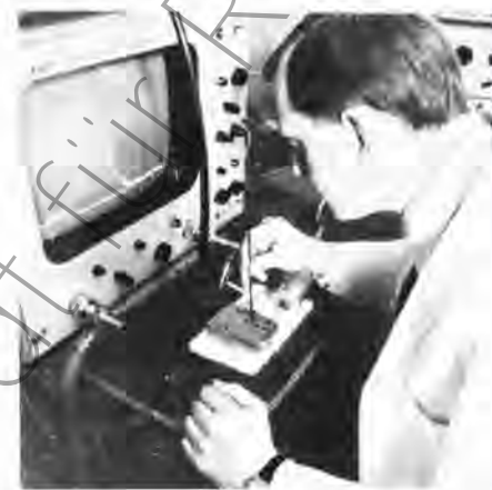
Meßplatz für den Abgleich von UKW-Eingangsteilen mit dem Eingangsteil UKW 1.

Die autorisierte Stellung des ZRF im Industriezweig Rundfunk und Fernsehen wird weiter dazu beitragen, zielstrebig an der Vorbereitung neuer noch leistungsfähigerer, formvollenderer und kostengünstigerer elektronischer Konsumgüter zu arbeiten. Die Angehörigen des ZRF blicken auf ein Jahrzehnt erfolgreicher Forschung und Entwicklung zurück und haben sich befähigt, noch größere Aufgaben zu Ehren unseres sozialistischen Staates zu übernehmen.