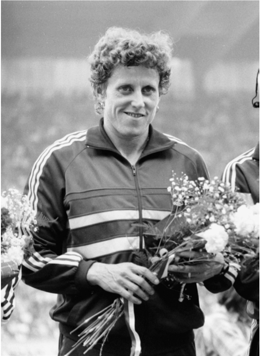
Abb. 4: Jarmila Kratochvílová, Leichtathletin aus der Tschechoslowakei und seit 1983 immer noch amtierende Weltrekordhalterin über 800 Meter bei den Frauen