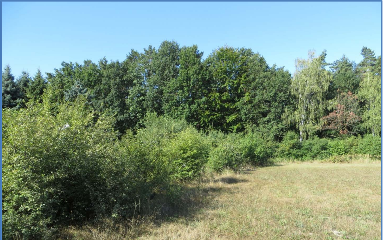
Abbildung 15: Sommerliche Heckenansicht von der Wiesenseite.