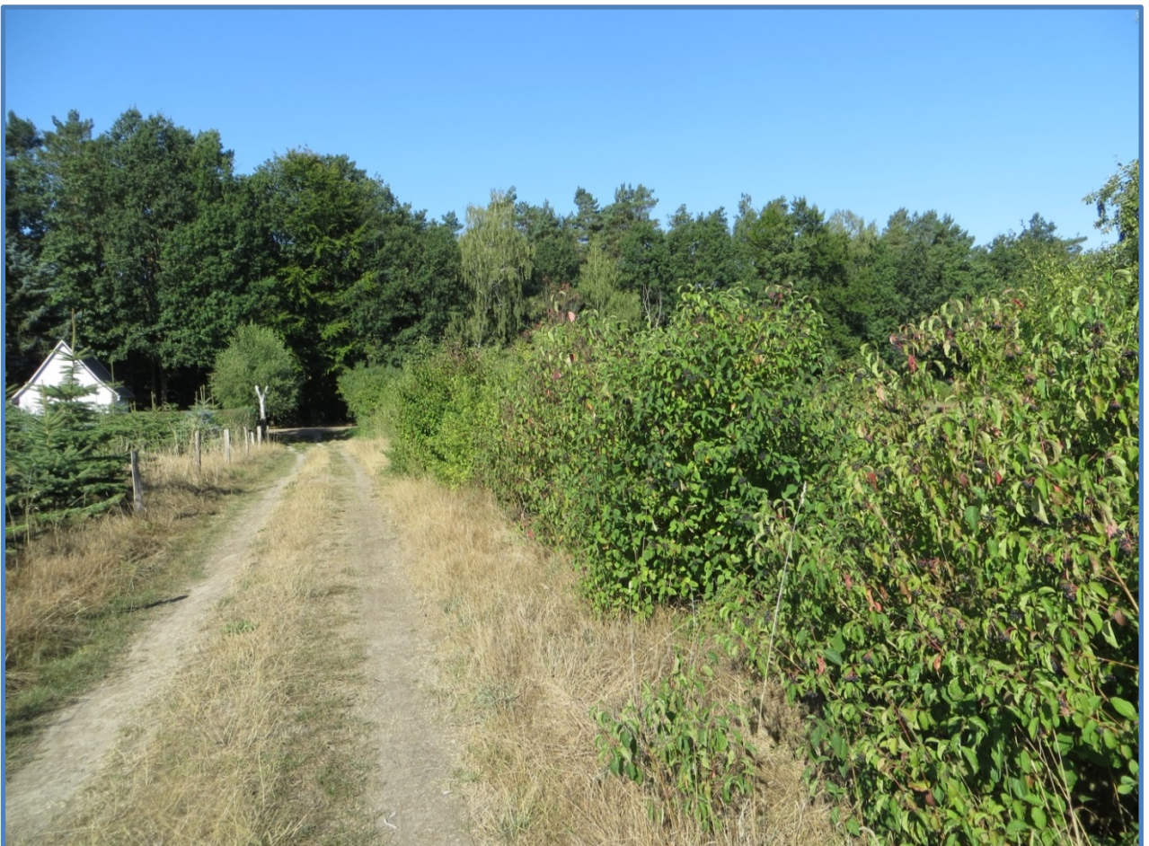
Abbildung 16: Heckenansicht vom Weg.