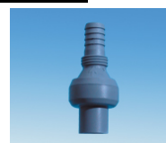
Rückschlagventil mit Entlüftung / non- return-valve with venting 3004.53.00