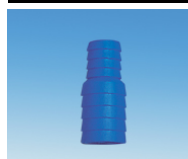
Entlüftungsstutzen / vent connection C1.0605.01