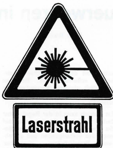
Abb. 4. Warnschilder, Schrift schwarz, Grund gelb.

Behrungen: Die Mitarbeiter sind über die Eigenschaften der La-